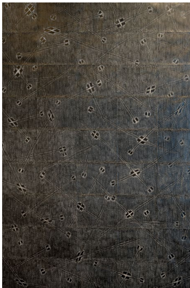
GALLUSZ Gyöngyi: Folyamatos táj , 2005, grafit, papír, 189×143,5 cm Fotó: Berényi Zsuzsa HUNGART © 2022

E rövid elméleti bevezető után szembesítsük a teóriát a tényekkel, vegyünk szemügyre néhányat a művek közül. Gáyor Tibor fekete alapon megjelenő, egybekapcsolódó, fehér geometrikus motívumos képe, az Átlós történekek (2004) utal leginkább a konstruktivista hagyományokra. Maurer Dóra Rajzolás kamerával (1978–2017) című alkotása szövegekkel ellátott konceptuális vázlatrajz. Hasonló szemlélet jellemzi némi dokumentációval vegyítve Rákóczy Gizella Hajlított spirálvonal 1.