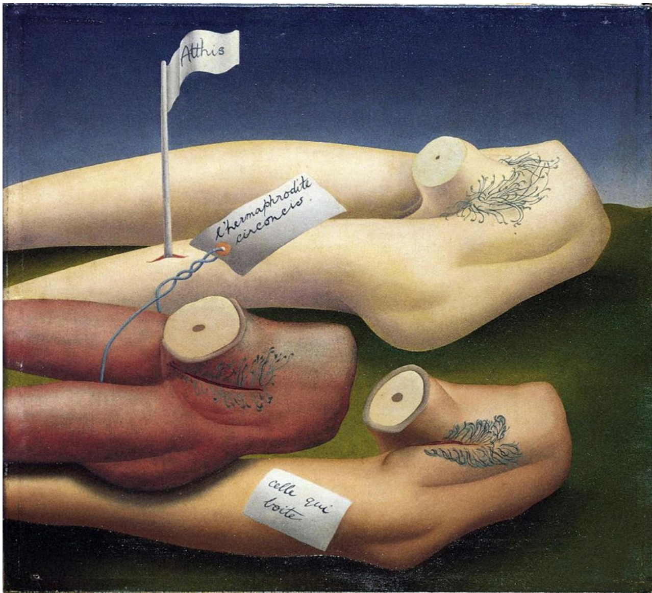
Ithell COLQUHOUN: The Pine Family , 1940, Israel Museum Jerusalem – Vera and Arturo Schwarz Collection of Dada and Surrealist Art in the Israel Museum ←

Mégis igaz, hogy a részvételre felkért művészek több mint 80 százaléka nő, a férfiak most először vannak kisebbségben. A rituális áldozat itt a nyugati fehér férfi hatalma és központi szerepe. Persze nem Alemani a gyilkos, és nem is az 59. Képzőművészeti Biennálé. Az áldozati bárány jó ideje tévelyeg fiktív roncsai között szinte minden művészeti ágban (a való életben persze nem) – sebzett testtel, hatalmától megfosztva, már az alvásban és az álmokban sem lelve menedéket. Ennek a biennálénak az igazi főszereplői a nők és azok a műfajok, amelyek a közelgő metamorfózis hordozói.