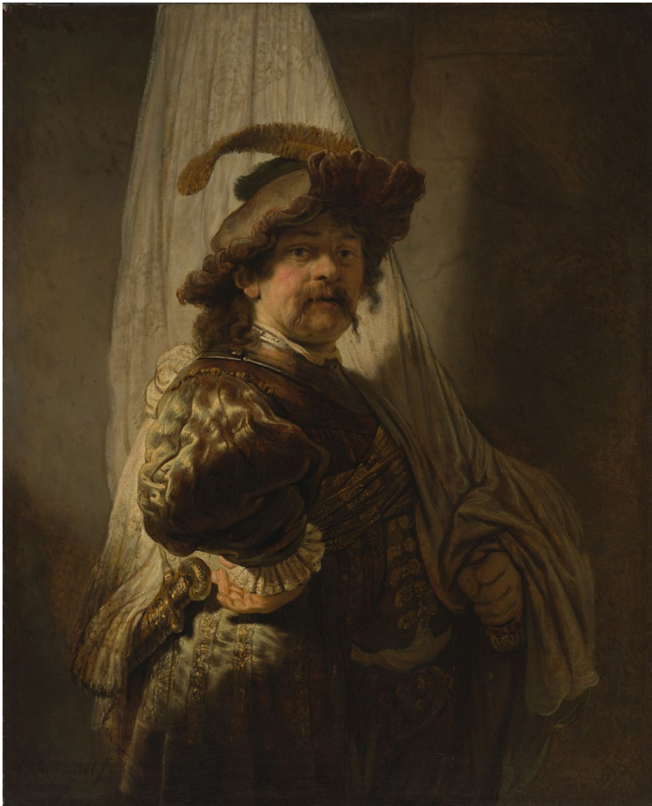
Rembrandt van RIJN: A zászlóvivő, 1636, olaj, vászon, 118,8x96,8 cm