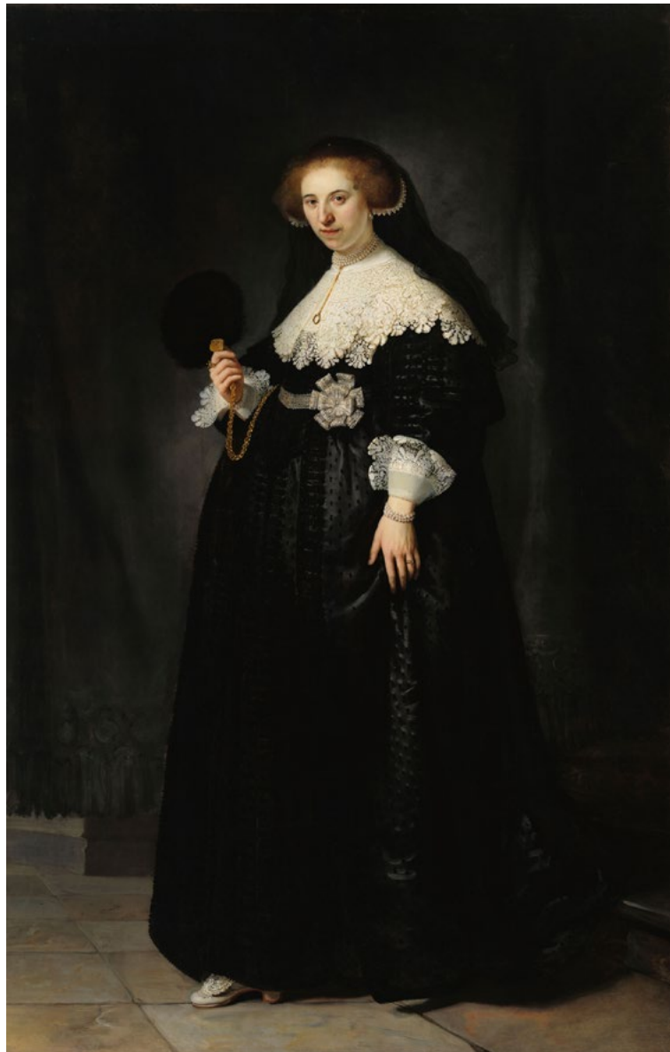
↑ Rembrandt van RIJN: Oopjen Coppit , 1634, olaj, vászon, 207,5 cm×132 cm

A zászlóvivőt történelmi és művészettörténeti szempontból is jelentős alkotásnak tekinthetjük egyrészt az akkoriban még a spanyol Habsburgok fennhatósága alatt álló Németalföld nyolcvan évig húzódó függetlenedési törekvéseit megtestesítő alak ábrázolása révén, másrészt pedig mivel a portré antitípusa az egyetemes művészettörténet egyik legismertebb alkotásának, az 1642-ben festett Éjjeli őrjárat nak. Taco Dibbits, a Rijksmuseum főigazgatója szerint a zászlós portré ugyanakkor Rembrandt alkotói szuverenitásának is az egyik