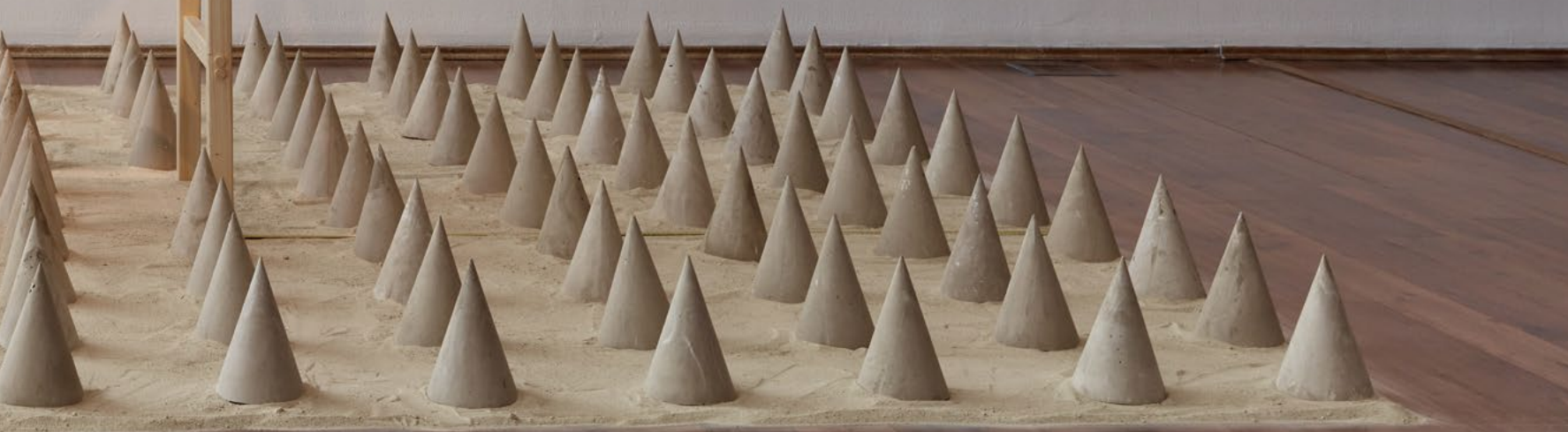
MOLNÁR Judit Lilla: Esési tér , 2021, beton, homok, fa, hordó, zománc, akril HUNGART © 2022