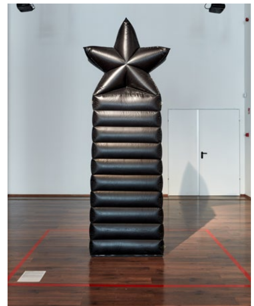
↑ Uladzimir PAZNIK: Mi csak megdőlünk, és ők a mennybe mennek , 2021, poliuretán HUNGART © 2022

ironikusan is önkolonializál. Jó lenne ezt a nézőpontot meghaladni. Ahhoz, hogy meghatározzuk, hogy mi a régió, nemcsak egy másikhoz való viszonyát kell vizsgálni, hanem érdemes önmagában is megvizsgálni. Az elmúlt évtizedekben sokszor volt róla szó, hogy hogyan és miért vagyunk lemaradva Nyugat-Európától. Ezzel tisztában vannak az emberek, nem ez az aspektus