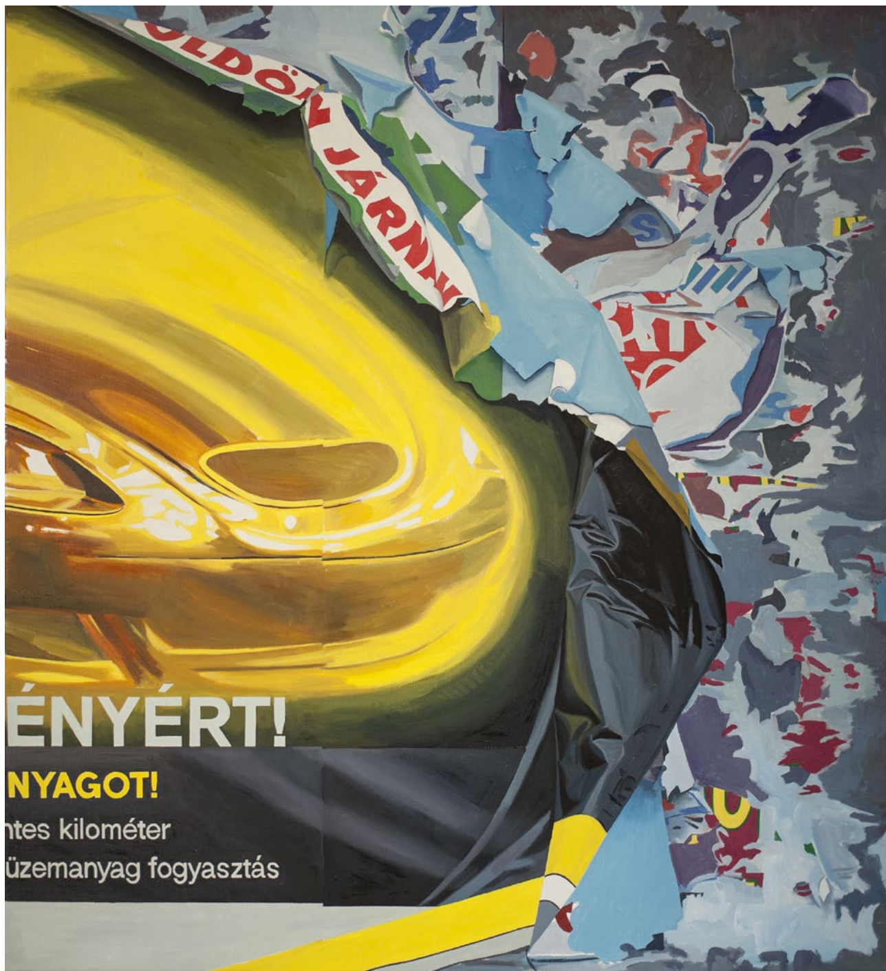
ZAKARIÁS István: Dekonstruált üzenet, 2015, olaj, vászon, 110x120 cm A művész jóvoltából →

tett valóságként íródna a képtáblákra. A művek „feldolgozásának” manualitása az egyes alkotások digitális hivatkozásai ellenére is meghatározó marad. Hiába lebegnek a Windows 10 egyik képernyőkímélőjének buborékjai Benczúr Gyula II. Rákóczi Ferenc elfogatása Nagysáros várában című, 1869-es festményének olajnyomata előtt, a kidolgozás valószínűtlen precizitásával a művész az analóg festészet lehetőségeire irányítja a figyelmet. Pető Hunor digitálisan manipulált fotóművei – melyekben többnyire természeti közegben, például fakérgék helyén derengenek fel hússzerű textúrák – az undor abszurditását hozzák játékba. Miközben a látogató a monumentális printek kényelmetlenül emberi, abjektuszerű aspektusával szembesül, önkéntelenül is megkerüli a tér közepére installált, téglatestekre kasírozott oroszlánszobor-csoportot, melynek minden oldalán az oroszlánok méltóságteljes köfertyája rajzolódik ki. A körbejárhatóság tényét konok egynézetűséggel összekuszáló műcsoport térbeli anomáliája fontos dinamikát emel ki, mely a kiállítás alapvető kérdéseként fogalmazódik meg: hogyan lehet művek révén elbizonytalanítani a valóság kézzelfogható reprezentációját?