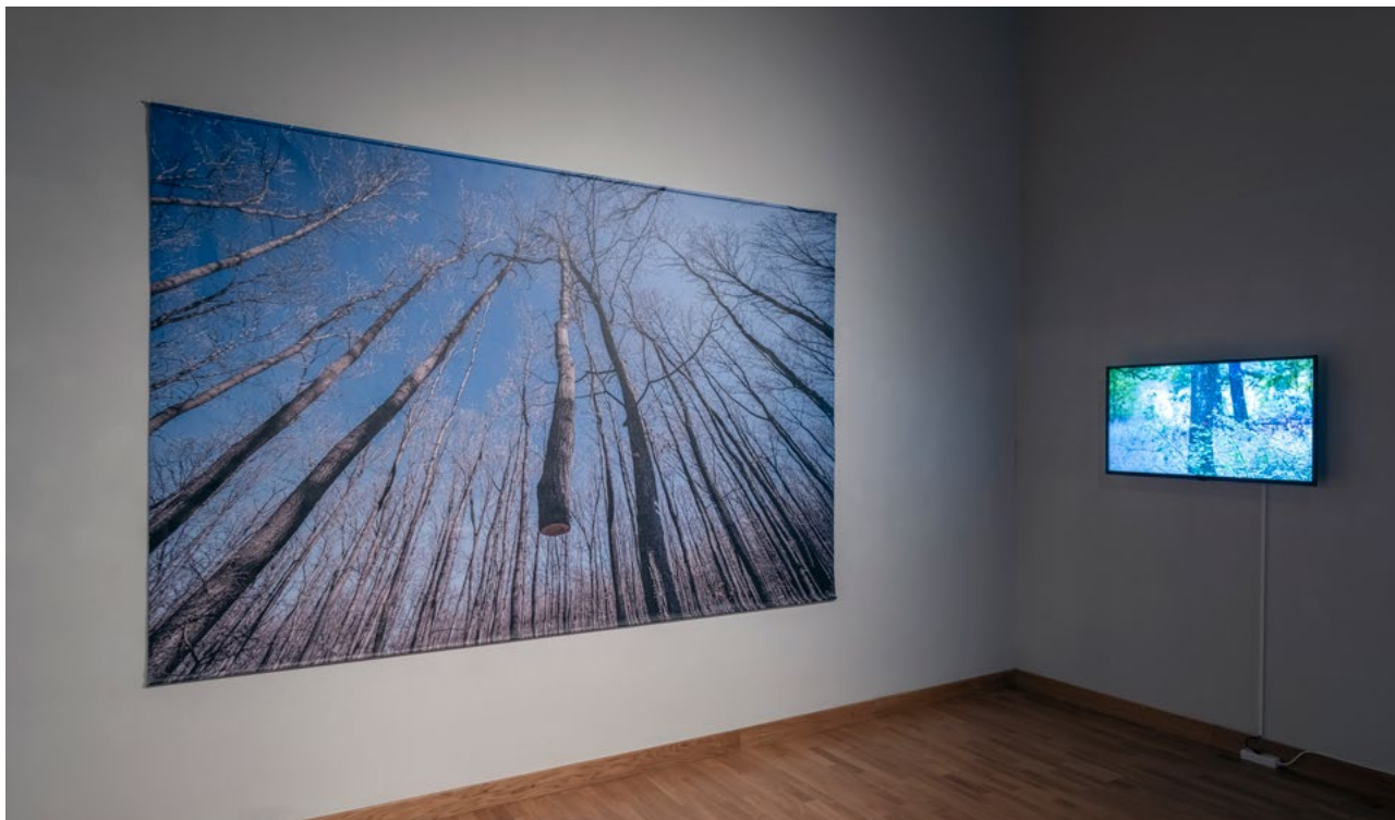
Kiállításenteriór SZIGETI G Csongor munkáival