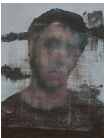
CSÓKA Szilárd Zsolt: Cliché Boy , 2021, olaj, vászon, 30x40 cm

Csóka Szilárd Zsolt kiállítása Kispont Galéria, 2022. február 18. – március 1.