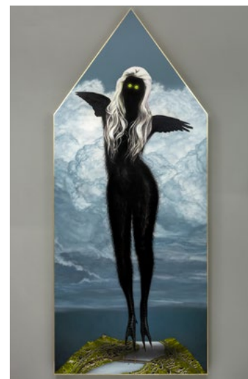
LŐRINCZ Áron: Succubus No. 8 , 2021

Lőrincz Áron kiállítása Longtermhandstand, 2022. január 31. – február 24.