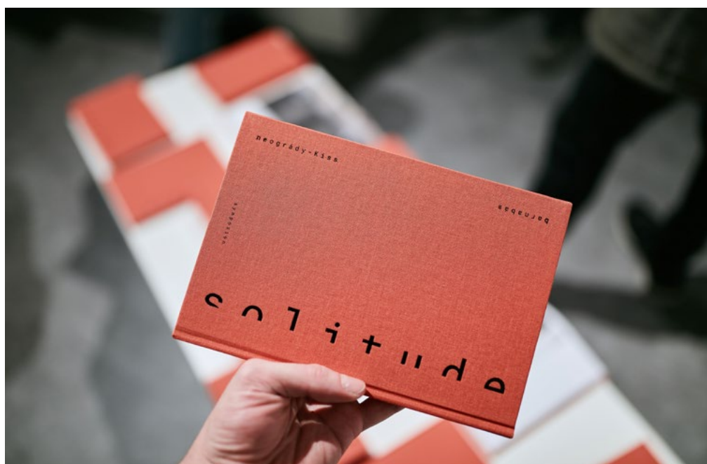
↑ NEOGRÁDY-KISS Barnabás: Solitude , Symposion, 2021, Létminimum Bázis

SA: Erősen hiszel a kulturális heterogenitásban?