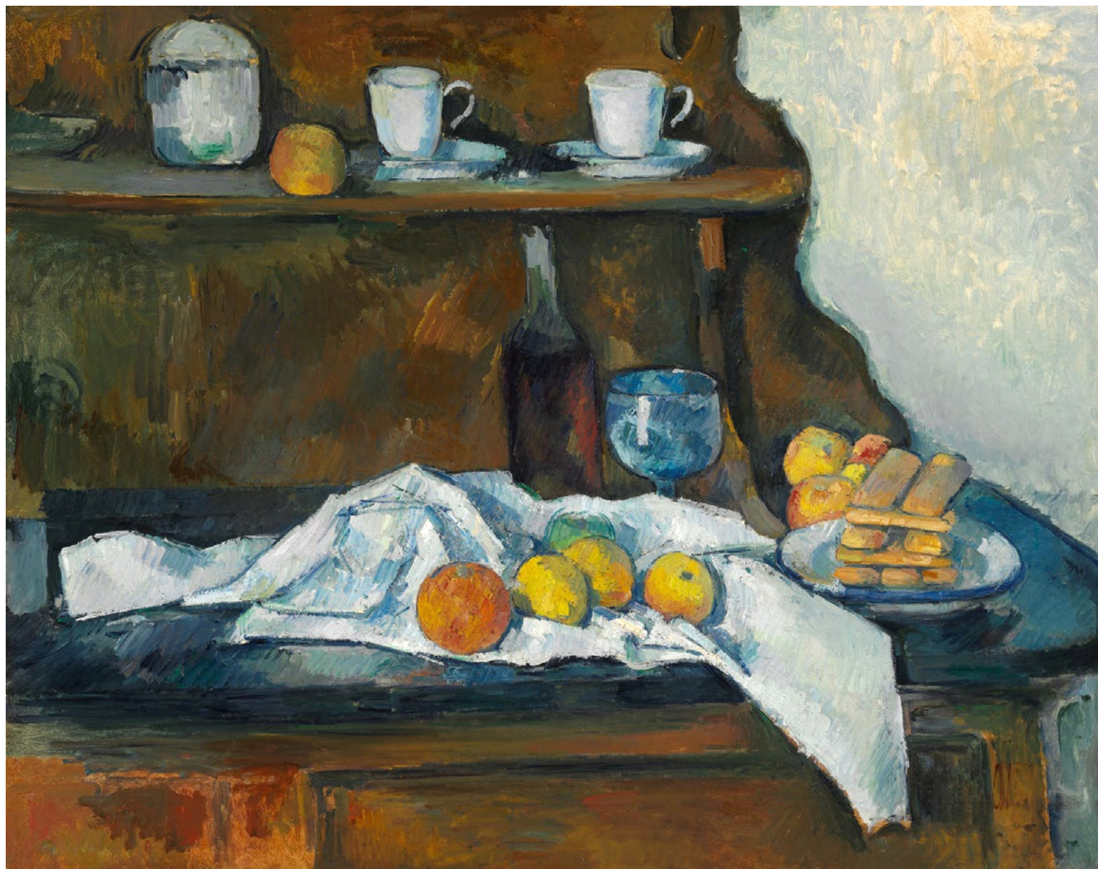
↑ Paul CEZANNE: A tálató, 1877–1879, olaj, vászon, 65,5×81 cm Szépművészeti Múzeum, Budapest

első (és utolsó) önálló kiállítását 1895-ben rendezte meg Ambroise Vollard a galériájában. A konstruktív korszak végét és az utolsó periódus kezdetét ez az esemény jelzi. Életének utolsó évtizedben nagyszerű vásznakat festett, stílusa megújult, és a különféle témátípusok zárókövei a helyükre kerültek.