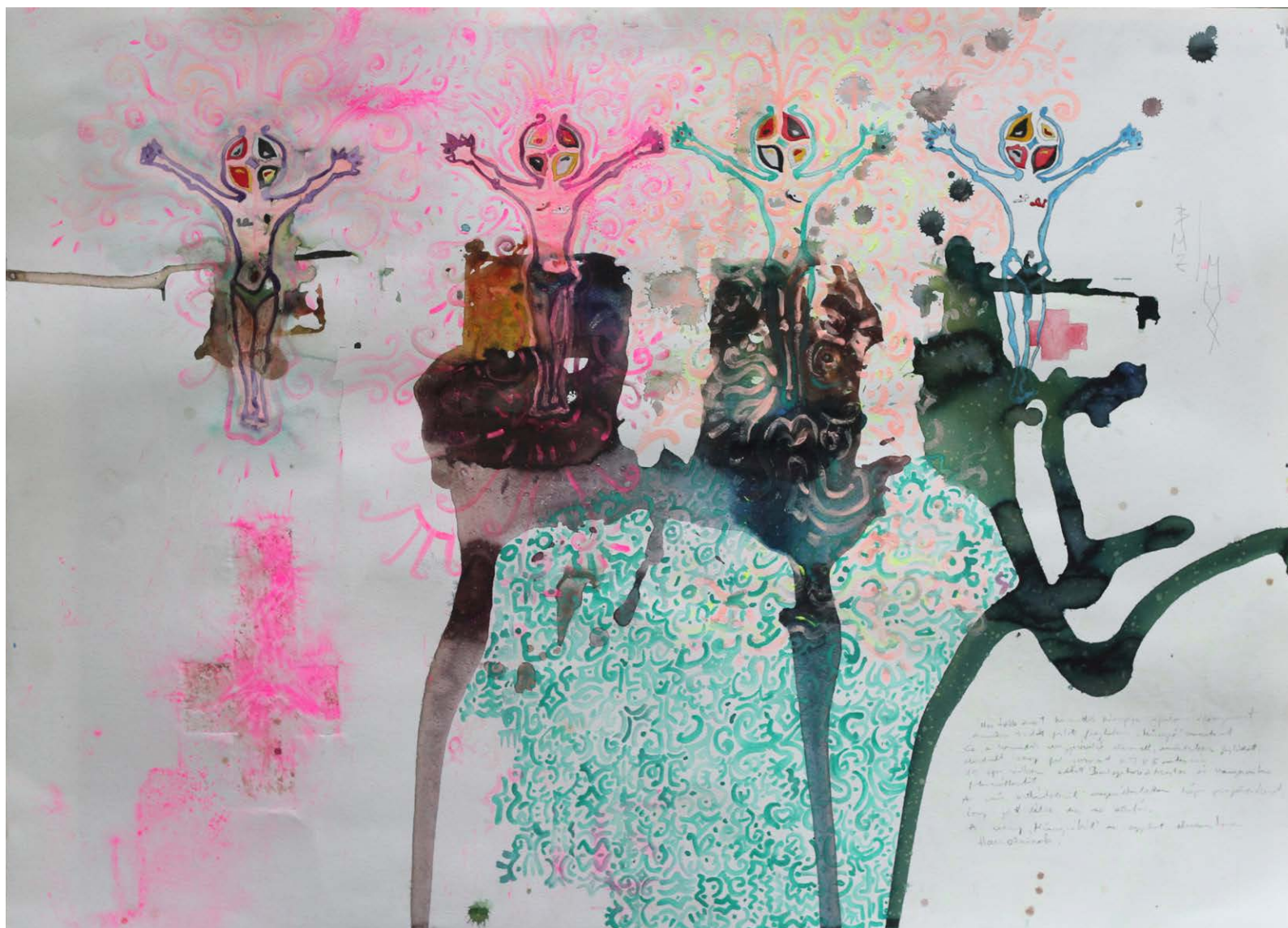
↑ BMZ: A négy Műugróból az egyiket elneveztem Ha-Nocri nak, akvarell, karton, 75x106 cm, 2020 A művész jóvoltából

kihasználva igyekezett a megidézett személyiségek jegyeit is beépíteni a három, korábban már kidolgozott felépítményű törzsre helyezett szoborba. A B/3-as blokk téglából, válaszfaltéglából készített „töltégek” a szobortestek belsejébe rejtett vas menetszárakkal húzta össze, felületüket foszforeszkáló, éjjel világító festékekkel díszítette, majd védő patinaként kőbalzsammal fújta le.