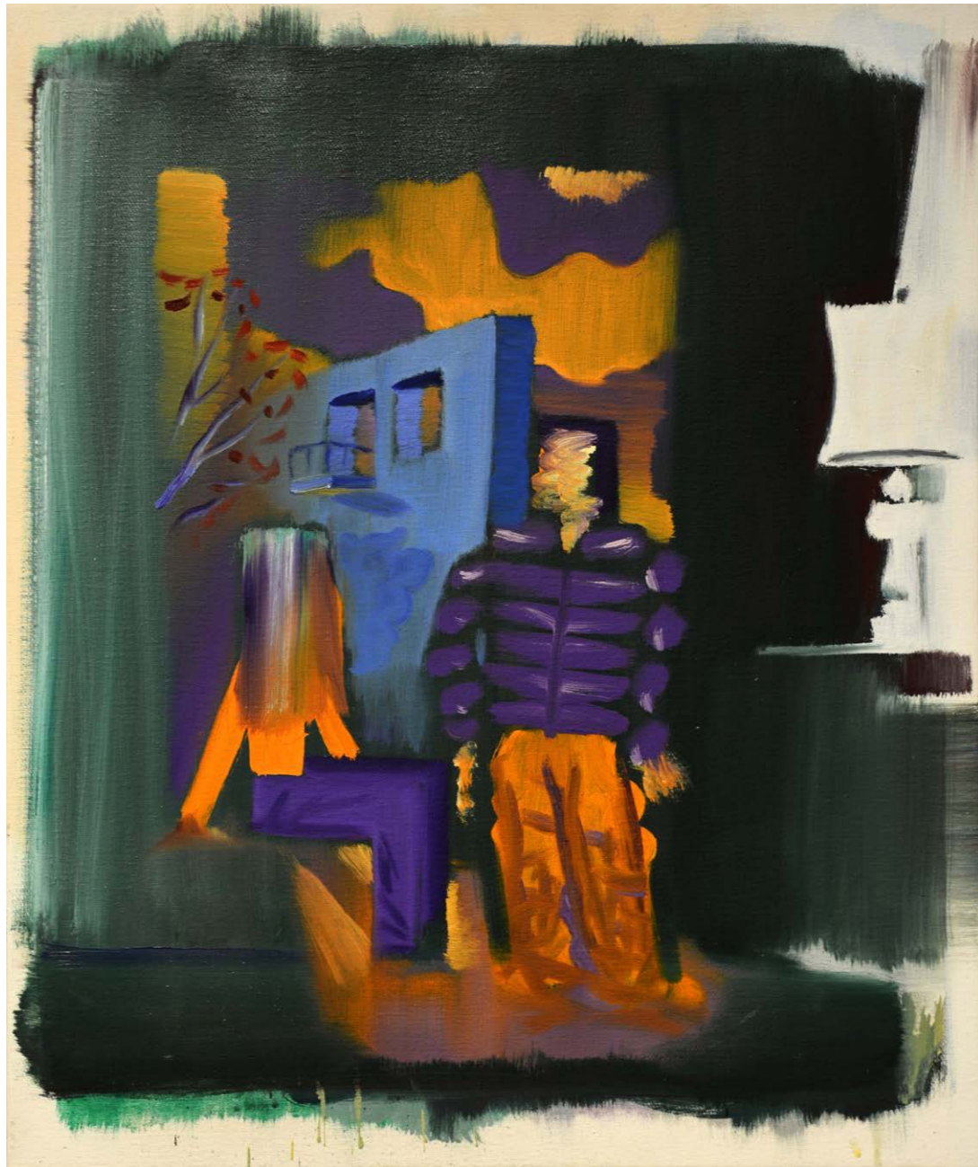
PINTÉR Gábor: Cím nélkül, olaj, vászon, 50x40 cm HUNGART © 2021