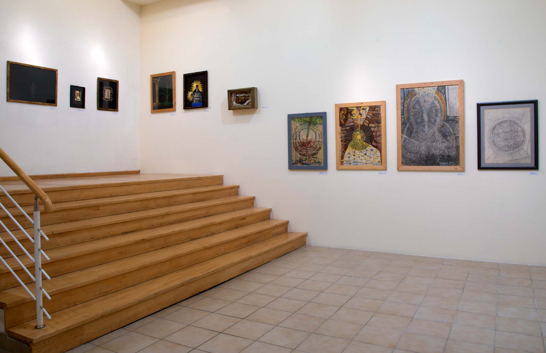
↑ Kiállítási enteriőr