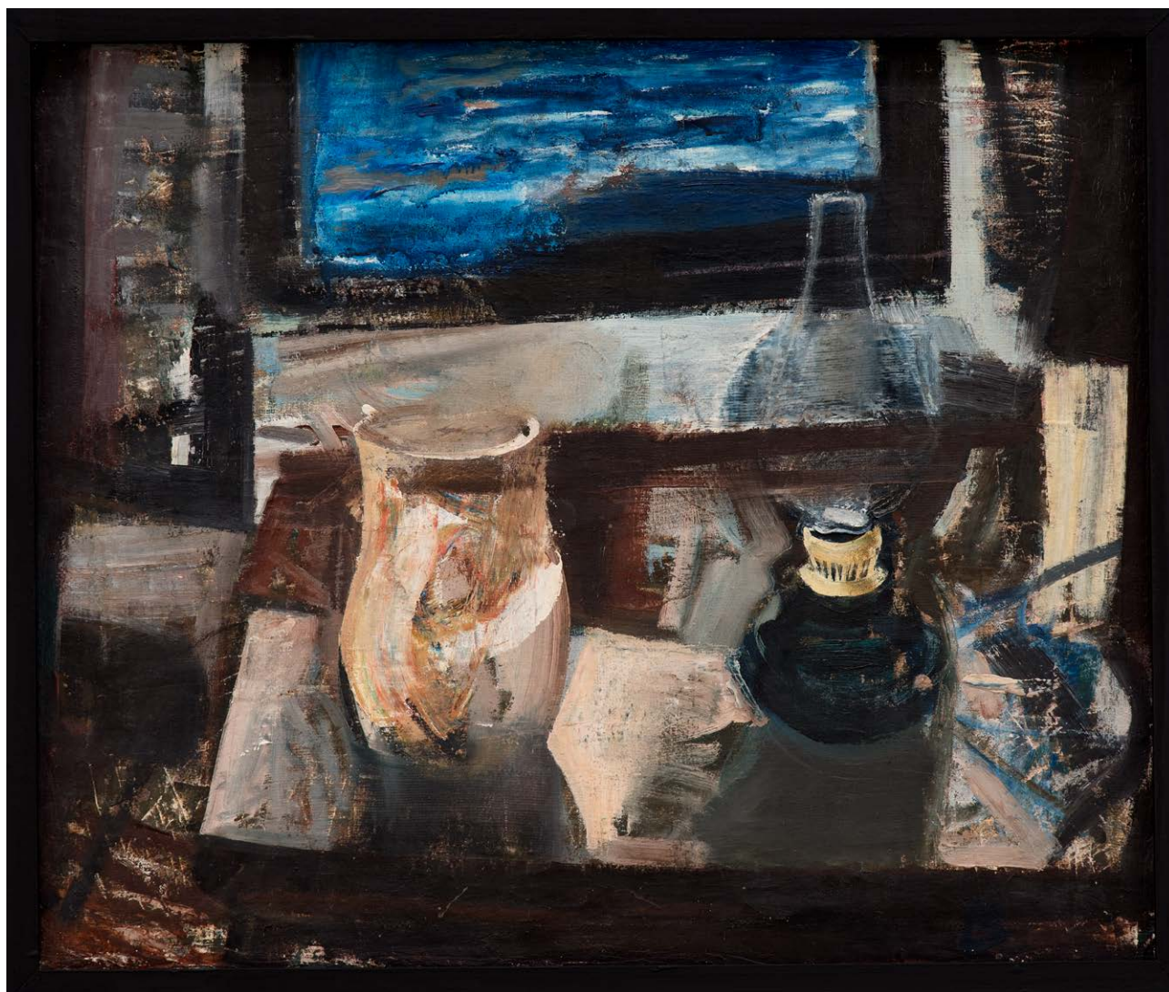
BARANYAY András: Csendélet petróleumlámpával, 1964, olaj, vászon, 50×60 cm HUNGART © 2021 →

önmagát, csak a felemelt kezeit, míg nem belepillantott a tükörbe. Megérkeztünk. A végtelenbe tartó, egylényegű Baranyay-művek elejéhez jutottunk. Adott a művész a tükörrel, és adottak a művész kezei. A kierkegaard-i világ két lényegi Baranyay-attribútumát látjuk. Az arc a lélek tükré, a tükör lakta arc tükré a kéz, a kéz az önarcképműfaj utolsó megdobható dobása. Baranyay András, mint Chopin, témáinak hihetetlen gazdagságát produkálta kis kiterjedésben elbűvölő vagy akár elrettentő ködökből felszejlő önarcképeiben, ezek lehettek arcai, kezei, csíkos és mindenféle ingei.