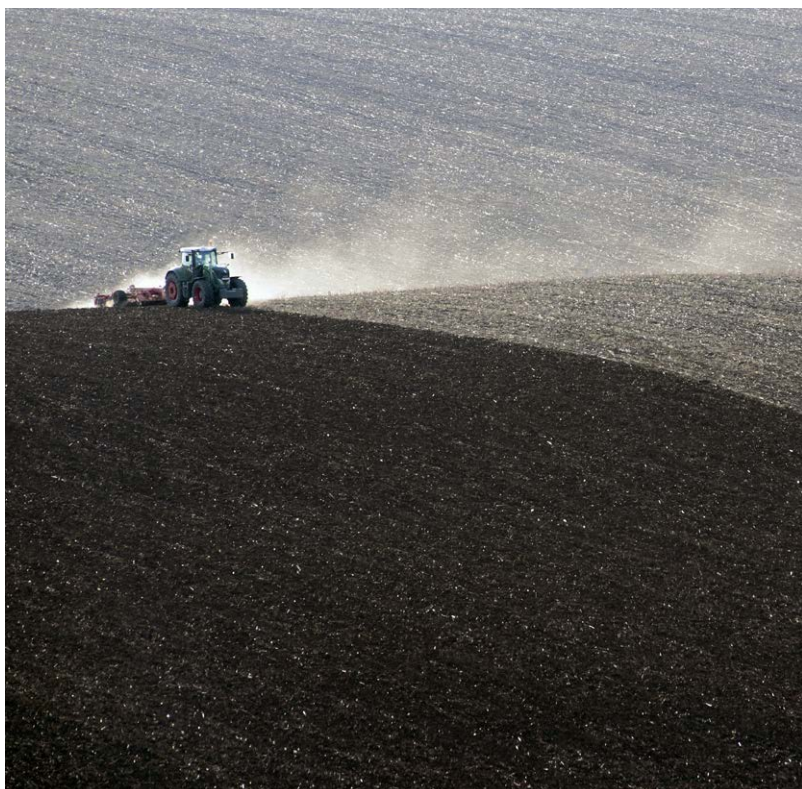
↑ HERBST Rudolf: Határban, fotó, 20×20 cm HUNGART © 2021

A plasztikai ábrázolásban, a szobrászatban a horizont definíciója értelemszerűen egészen más mondanivalót hordoz, mint a síkművészetekben. Lipcsey György kubisztikus hasábokból, éles síkokból konstruált, különös, időtlennek (egyszerre modernnek és egyben archaikusnak) tűnő, masszív architektúrája az időhorizont asszociációját is eszünkbe juttatja. Vasvári Sándor László a horror vacui elvét alkalmazó, történeti korszakokból merítő, enciklopédikus kollázsra szintén az időtényezőt emelte be vizsgálatába.