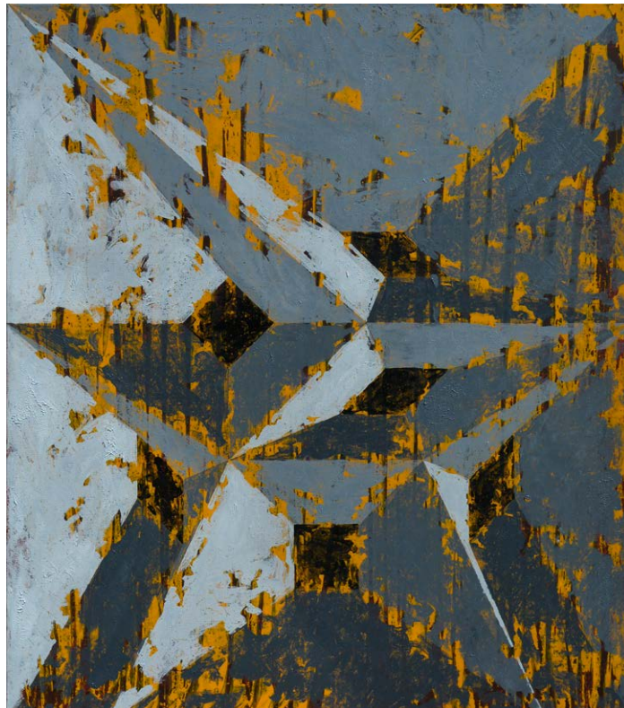
↑ ÁRVAI György: Nyom, akril, fa, 100×100 cm HUNGART © 2021

F. Farkas Tamás az érzéki csalódásokra épülő, kétértelmű alakzatokból, Penrose-háromszögekből strukturált munkája egyfajta szellemi horizont képzetét kelti. Felházi Ágnes látomászerű Perpetuum mobile -je, Luzsicza Lajos Árpád játékos, színes, leegyszerűsített formaképzése is egy álomszerű ábrándvilág „láthatatlan” határai felé csábít kalandozásra.