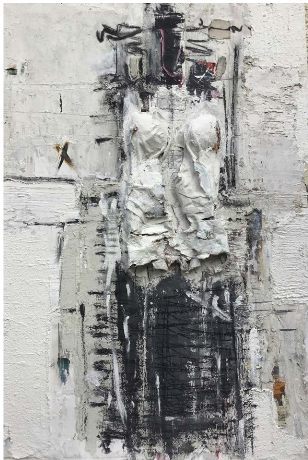
KOVÁCS Johanna: Próbafülke, papír, akril, síkplasztika, vászon, 100×70 cm HUNGART © 2021 ← ←