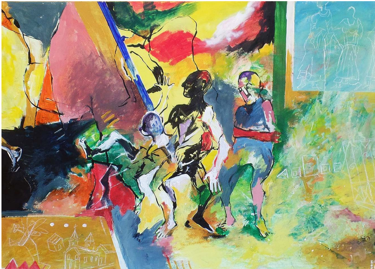
DROZSNYIK István: Volt egyszer egy gyerekkor, akril, karton, 70×100 cm HUNGART © 2021 →

A MAOE idej meghívásos pályázatára csakúgy, ahogyan azt az előző esztendőkből is láthattuk, a hazai kortárs művészet szereplői nagy számban jelentkeztek. A tárlatsorozat szervezőinek kezdetektől felvállalt szándéka, hogy jelenkori vizuális művészetünk széles – engedjék meg a szójátékot – horizontját bemutatva a művészetek gyakorlóinak minél kiterjedtebb körét szólítsák meg, felvállalva azt, hogy az enumeráció erejét nem feltétlenül az egyes alkotások kvalitása, hanem annak kollektív jellege határozza meg. Ennek megfelelően a különféle interpretációknak, művészi megoldásoknak