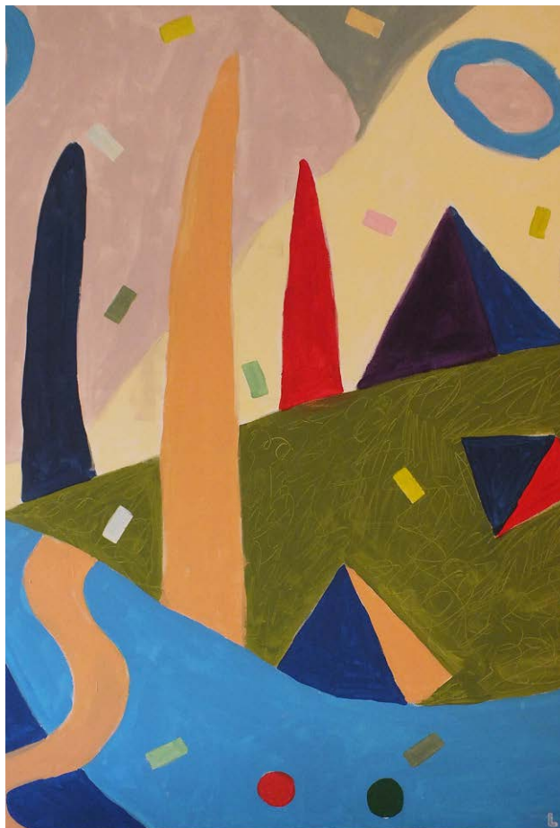
LUZSICZA Lajos Árpád: Lila triangulum, térben, akril, karton, 70×50 cm HUNGART © 2021 ←

A kiállításon talán ez a legérdekesebb, hogy a mottóban megfogalmazott, alapvetően egyszerűnek és érthetőnek tűnő – de valójában meglehetősen bonyolult, a különböző tudományágak által is számos definíciót alkalmazó – fogalomra milyen művészi megoldások születtek. Leegyszerűsítve, a műveken leginkább az látható, hogy az alkotó honnan vizsgálódik, hová is helyezte nézőpontját. Vizsgálódó horizontunk határait is szűkebbre kell szabjuk, így a következőkben az idei díjazottak alkotásainak rövid elemzésén keresztül próbáljuk meg érzékeltetni azt a sokszínűséget, amelyet a közel hatszáz alkotás fémjelez.