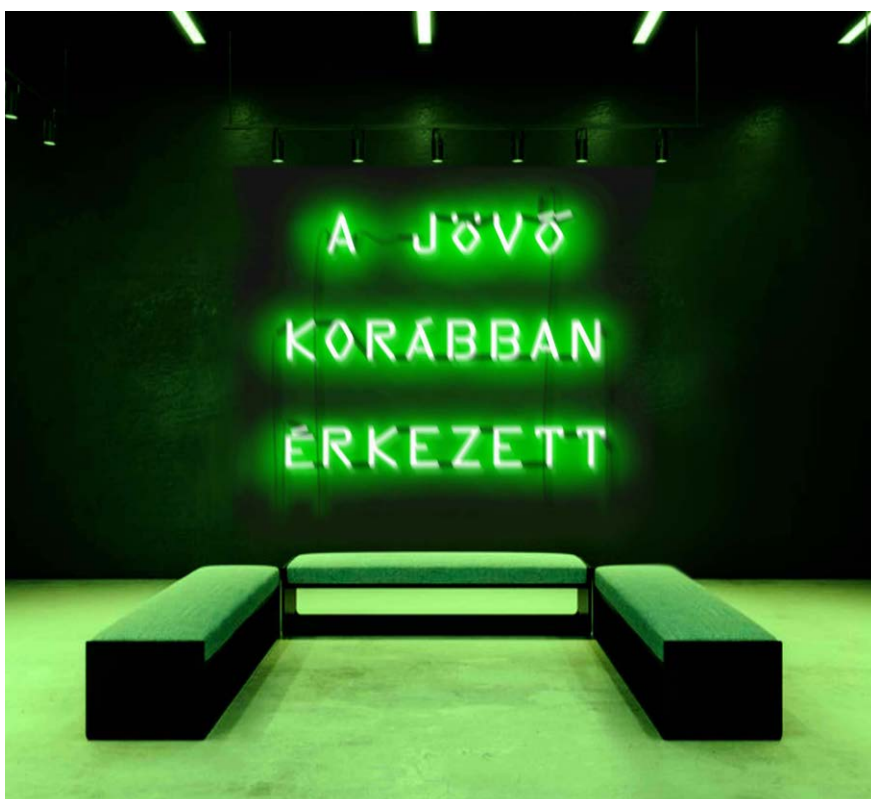
HÉRICCS Nándor: A jövő korábban érkezett, neon, habosított PVC, 250×250 cm HUNGART © 2021 ↓

sokféle változatát láthatjuk a szegedi REÖK termeiben, a hely adottságaihoz konstruált, a kiállítóterek pulzáló, egy sorba felfűzött, a fin de siècle ritmusához illeszkedő egységes térinstallációban.