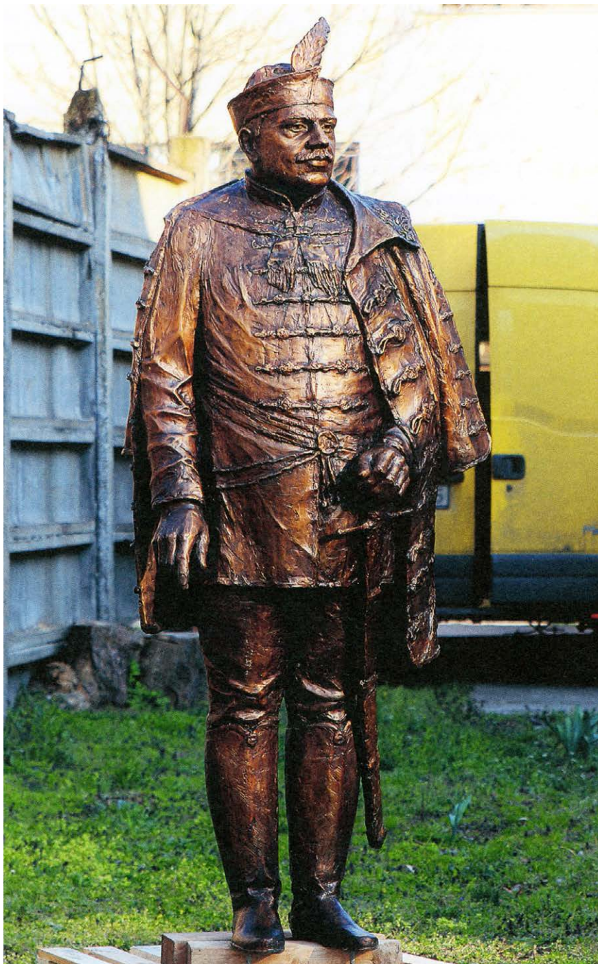
↑ PETŐ Hunor: Hóman Bálint szobra Fotó: Pető Hunor, 2015

korszakokat befolyásoló államférfi tipológiáját, markánsan megkülönböztetve a kiszolgáló-végrehajtó politikus-tól. A mai világ képe négy vaskos kötete közül az első, A szellemi élet szerkesztése fűződik közvetlenül a nevéhez (Királyi Magyar Egyetemi Nyomda, 1938) vagy a több mint ezeregyszáz oldalas szintézisének, a Tudomány és társadalomnak a megírása és megjelentetése (Franklin, 1944), mely évszáma ellenére éppenséggel nem aktuálpolitikai igazolás, hanem az alcíme szerint valóban A tudomány szociológiája akart lenni.