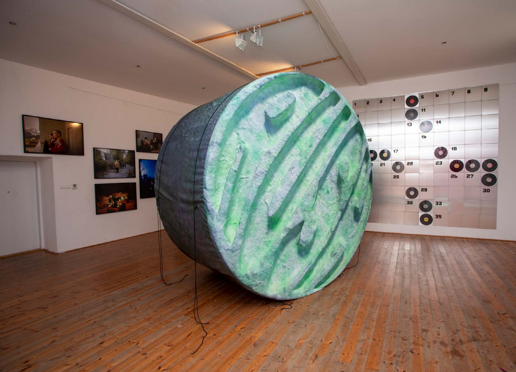
Techno Worlds, aqb Project Space, kiállítási enteriőr ↓

is kereshetjük, hiszen az első hang, amelyet életünkben hallunk és érzünk, a magzati korban anyánk szívverése. A trance, a tribal techno vagy a deep house zene gyökerei sokszor kapcsolódnak a sámánizmus, az ősi civilizációk hagyományaihoz. A sámán mint kiválasztott spirituális vezető kántálással, a dob egyenletes verésével esik révületbe, lép át a szellemvilágba, így hozva létre a két szféra közötti kapcsolatot. Ennek a megváltozott tudatállapotnak az áthallásai találhatók meg a techno közönségének zenei élményeiben is.