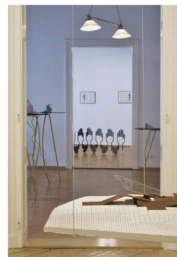
Kiállításenterió, A Town on the Edge , 2021, Art Department

„Kizárólag a rövid idejű jelenével hat, ezért a jelen véleményét testesíti meg a múlttal vagy a jövővel kapcsolatban” – így jellemezte Rajk László Non-standard építészet című írásában az ideiglenesen, egy-egy alkalomra létrehozott építményeket, díszleteket, átmeneti tereket magában foglaló, provizórikus építészetet. A téralkotás e lázadástól sem mentes, illékony formájában talált otthonra Rajk radikális és formabontó építészeti vízióinak nagy része. A kiállítás ehhez a jelenidejűséghez kapcsolódik. Az A Town on the Edge című földrajzi perifériára, az építészet korlátainak feszegetésére, valamint a rebellis művész karakterére utal. A Kis Varsó művészpáros (Gálik András, Havas Bálint) és Schmied Andi új vagy korábban még nem publikált munkáikkal kapcsolódnak Rajk életének és művészetének valamely pontjához.