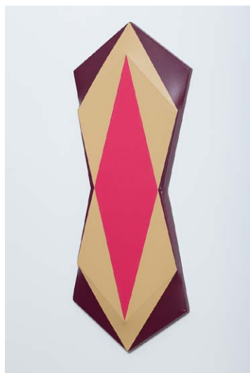
FORGÓ Árpád: Mirror Pentagon , 2014, akril, formázott vászon, 82×32×4 cm

Forgó Árpád egyéni kiállítása ENA Viewing Space, 2021. szeptember 25. – október 31.