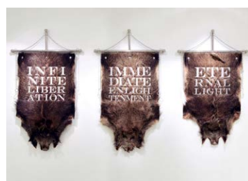
GERHES Gábor: Infinite Liberation, Immediate Enlightenment, Eternal Light , 2014, vaddisznóbőr, krómáccél, vas, 3 db, egyenként 130×90 cm

Történetek vadászatról, természetről Ludwig Múzeum – Kortárs Művészeti Múzeum, 2021. szeptember 23. – november 21.