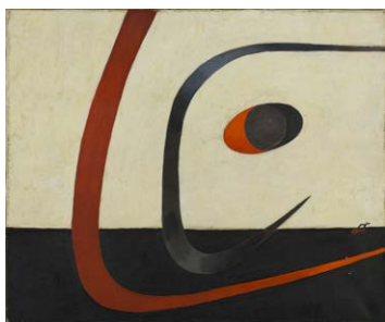
TIHANYI Lajos: Absztrakt festmény , 1933, Párizs, Centre Georges Pompidou, MNAM-CCI, Dist. RMN-Grand Palais – © Bertrand Prévost

A kiállítás a valaha volt legnagyobb szabású, hivatalos, nemzetközi nonfiguratív csoportosulás, az Abstraction-Création tevékenységét mutatja be, amely az 1930-as években a kor legprogresszívebb művészköreit vonzotta egész Európában. Ebből a nemzetközi körből teljesedett ki egy közel százfős társaság, amelyhez több mint húsz ország művésze csatlakozott. A világon mindenütt elismert és neves társaság a későbbi absztrakt körök mintaadójává vált. A legfontosabb korai absztrakt művészek életében egytől-egyig jelentős állomás és csúcspont az Abstraction-Créationhoz köthető munkásságuk. A tárlaton ezekből az életművekből láthatunk kulcsműveket – többek között Vaszilij Kandinszkij, Jean Hélion, Alexander Calder, Auguste Herbin, František Kupka vagy Jean Arp munkáit, valamint magyarokét, köztük Moholy-Nagy László, Alfred Reth vagy Étienne Beöthy a párizsi Abstraction-Création közegében. A kiállítás kurátora Dr. Mézsa Flóra művészettörténész.