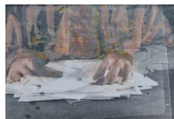
BARANYAY András: Őnarckép , 1973 körül, színezett zselatinos ezüstbromid, dokubrom papír, 39,5×26 cm, MissionArt-gyűjtemény

Baranyay András művészete Múcsarnok, 2021. október 6. – december 6.