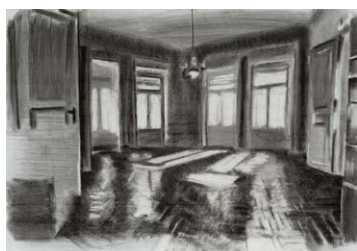
ÖTVÖS Zoltán: Eladó lakás, Budapest , 2021, szén, papír, 70×100 cm

„Figyelmem az elmúlt évben egy budapesti lakáshirdetésre irányult, amelynek fényképein egy elmúlt világ jelent meg számomra, és amelynek feltételezett új tulajdonosa majd ezt a világot »felújítja«. Ezt a felújítás előtti állapotot szerettem volna megfogni, ábrázolni egy 70×100 cm-es rajzsorozatban. Ekképpen, egy eladó budapesti lakás inspirációja alapján, az utolsó pillanatban megjelenítettem egy hallgatag, eltűnőben lévő Budapestet, ami kezd láthatatlan emlékké válni. Letűnni – eltűnni. Ezekben a képeken felsejlik az idő, a régi polgári lakások mélabúja és a beléjük hatoló fény, ami keményen, geometrikusan metsződik bele az álló levegőbe. A tiszta fény kontrasztba kerül a múlt levegőjével. A tiszta fény egy más idősíkot jelöl. A tiszta fény maga a bethesdai angyal, aki megkavarja a poros levegőt...” – Ötvös Zoltán