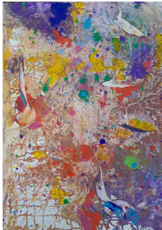
↑ MOLNÁR László: Fátyolköd , 2020, tempera, 50×36 cm HUNGART © 2021

A háború után az ideológiát mindenek fölé helyező szocreálban stagnált az akvarellezés. Később újjászületéséhez nagyban hozzájárult az 1968-ban Egerben megrendezett első akvarellbiennálé. A kiállítássorozatot útjára indító szövegében Németh Lajos a modern művészet eredményeinek figyelembe vételét és alkalmazását hangsúlyozta. Nem is eredménytelenül, hiszen a késő Kádár-korban az akvarellt, akárcsak a grafikát, a kötetlenség, a privát szféra bemutatása, a játékoság különböztette meg a még hosszú évekig ideológiától terhelt festészettől és a köztéri szobrászattól.