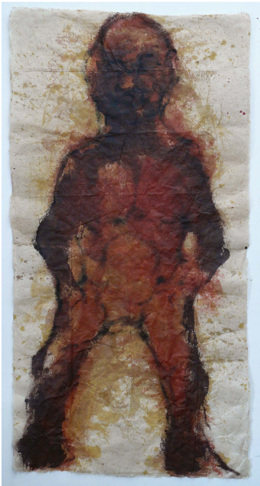
↑ GAÁL József: Umbra (Figura II.) , 2021, akvarell, porfesték, rizspapír, 170×90 cm HUNGART © 2021

festőanyaghoz képest aránylag sokat hágy a véletlenre. [...] Mennyi szeszélyes festői mozzanat támad már csak a színfoltok nedves egymásba ömléséből is. Mennyi finom átsugárzás és markáns sűrűsödés.” 2