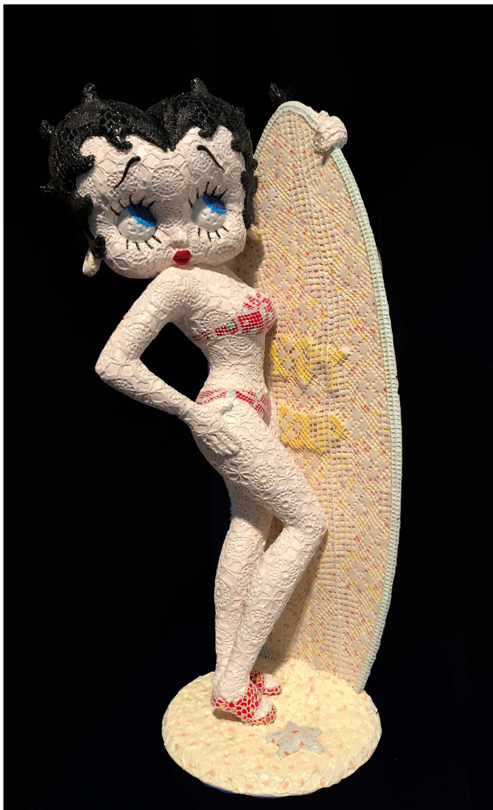
HAVADTÓY Sámuel: Betty , 2019, csipke, akrilfesték talált tárgyon, vegyes technika, 63×28×25 cm

HS: Nem szeretnék erről beszélni, ez sze- mélyes dolog, nem azért csinálom, hogy más is lássa. Ezt is Yokótól tanultam, mint annyi minden mást. De egy történetet elme- sélek. Egyszer elhívtam ide a műterembe egy nevelőotthonban felnőtt testvérpárt, és elmeséltem nekik, honnan indultam, és lám, itt vagyok. Olyan kevés segítség kell valakinek ahhoz, hogy talpra álljon, csak észre kell vennünk, mikor kihez kell egy jó szót szólnunk. Utálom azt a mondást, hogy a magyar a jég hátán is megél. Több ezer hajléktalan él Budapesten, nincs elég jég?