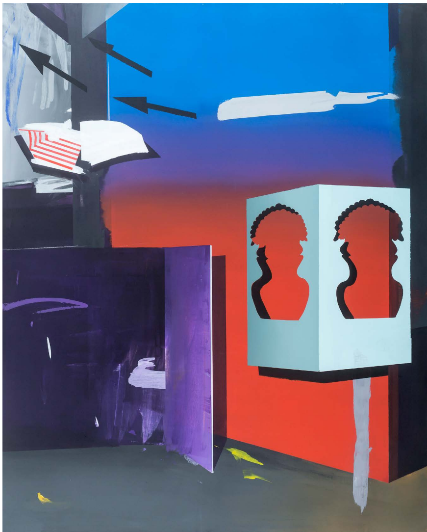
↑ TÓTH Zsófia: Csereszoba , 2020, akril, vászon, 140×115 cm Fotó: Bozó András A művész és a Neon Galéria jóvoltából