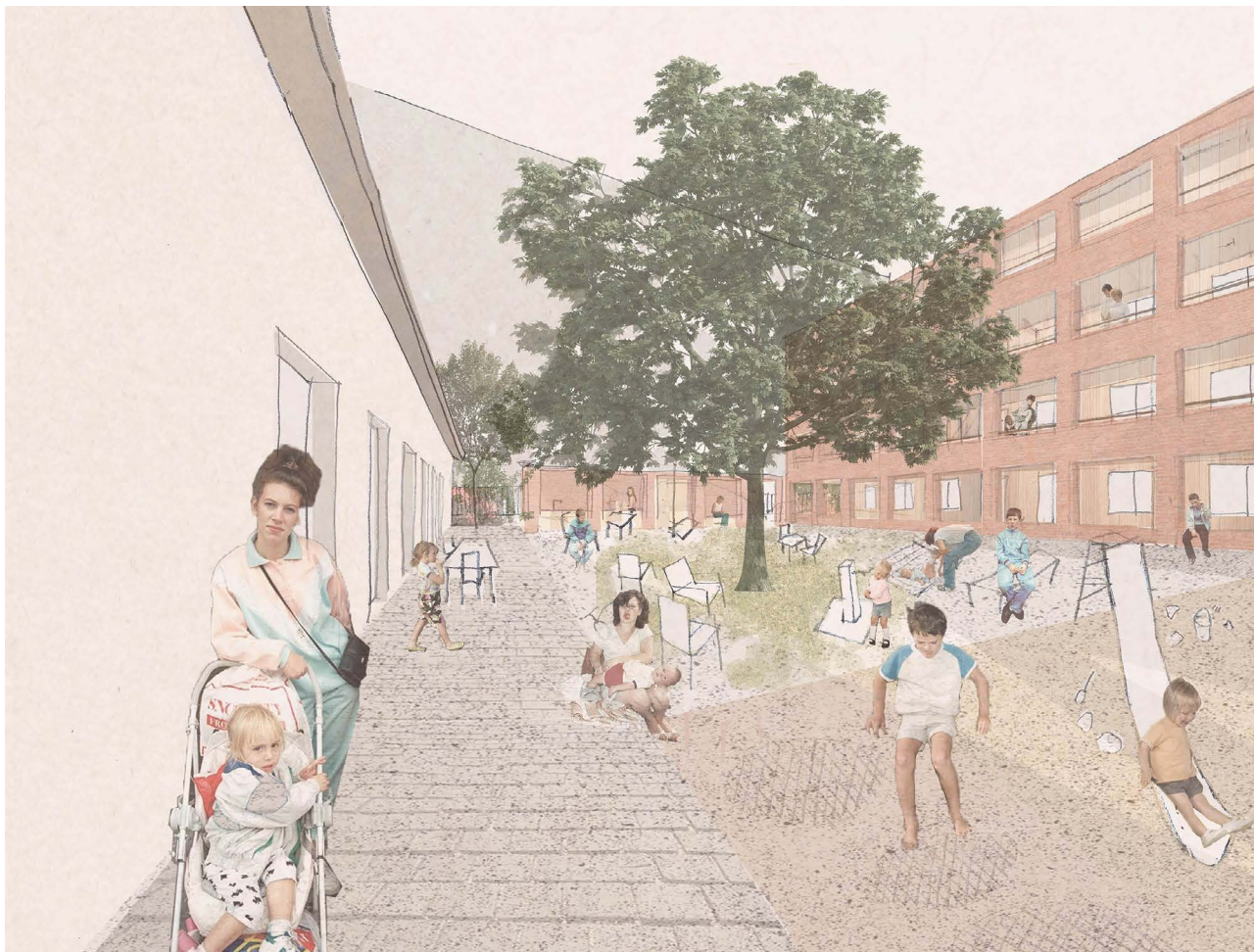
FARKAS Sára (építőművész MA): Több, mint menedék , 2021 ←