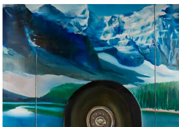
HORVÁTH Dániel: Busz , 2016, olaj, vászon, 140×200 cm

K Galéria, 2021. augusztus 26. – szeptember 24.