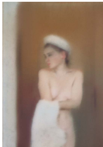
Gerhard RICHTER: Kis fürdőző , 1994, olaj, vászon, 51x36 cm

Gerhard Richter kiállítása Magyar Nemzeti Múzeum, 2021. augusztus 27. – november 14.