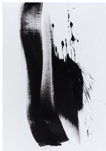
NÁDLER István: Szabadon , 2021

IKON, Vajda Múzeum, 2021. október 6. – 2022. január 9.