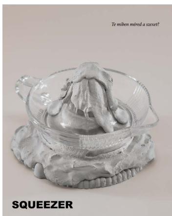
STANDOVÁR Júlia: Squeezer , 2019, Brooklyn, archív pigment nyomat, 75x56 cm

Standovár Júlia kiállítása TOBE Gallery, 2021. szeptember 1. – október 2.