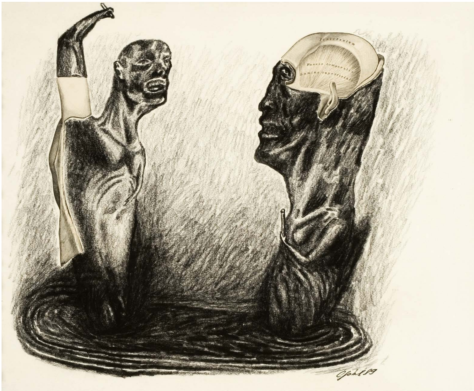
↑ GAÁL József: Prothesis IV. , 1989, akvarell, kollázs, 38×32 cm

arcképtörödékek, összeilleszthetetlen identitásprotézisek, fragmentumok, közties állapotok a „társadalmiasított” hisztéria formáiban. Konkrét etnikai sajátosságokkal nem rendelkezhetnek, főleg egydimenziós sémát leleplező nemzetszemlértó programot, „túlazonosulást” követelni. A metaarchaizmus egyik lényeges eleme a tragikus groteszk mint komplex esztétikai keret.