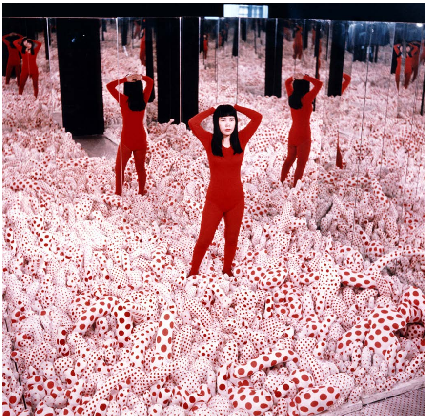
↑ Yayoi KUSAMA: Infinity Mirror Room – Phalli's Field (Végtelen tükörszoba, Phalli mezeje), 1965

tenni széles körű ismertségre, ilyen például a saját magát a művészettörténet legismertebb kompozícióiba helyező Yasumasa Morimura, a kaotikus pop-art képek művésze, Keiichi Tanaami, a mérges kislány figurájáról ismert Yoshitomo Nara, a kifeszített papírlapokon átszaladva alkotó Saburo Murakami, a lábbal festő Kazuo Shiraga, de különösen a saját univerzumot létrehozó Yayoi Kusama.