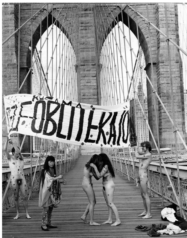
Yayoi KUSAMA: „Anti-War” meztelen happening és zászlóégetés a Brooklyn-hídon, 1968 →

Még Japánban talált egy könyvet Georgia O'Keeffe-ről, akinek művei annyira lenyűgözték, hogy elhatározta, felveszi vele a kapcsolatot. Levelezésük 1955-ben kezdődött, és O'Keeffe Amerikába érkezése után több alkalommal segített Kusamának, aki huszonhét éves korában hagyta el szülőföldjét. Útjára néhány száz dollár-