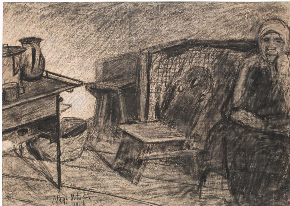
NAGY István: Anyám konyhája , 1914, szén, papír, 29,5×42,5 cm

lekerekített, plasztikus, szobrászias formái inkább az Aba-Novák Vilmos – Patkó Károly-baráti kör formaképzéséből és Nagyban nyárból táplálkoztak. Később festészetében egy színes, festői, inkább vékony ecsettel megformált, részletező megközelítést alakított ki, míg Nagy István megőrzi a világ leegyszerűsítő leképezését. Ugyanakkor a kiállítás képein is láthatjuk, hogy néhol kontúros, de puha és festői, máshol pedig azt érezzük, hogy szinte kivágott sávokból van a kép felépítve. Képes egy síkból építkező képi világot kialakítani, és képes nagyon intenzív kézmozgással – szénrel vagy ecsettel – a felület grafikai hatású szövetét létrehozni. Idéztem Egry Józsefet a redukcióról. Nagy István húzott egy vonalat, az a horizont, alatta van valami, a föld vagy a víz síkja, ami fő-