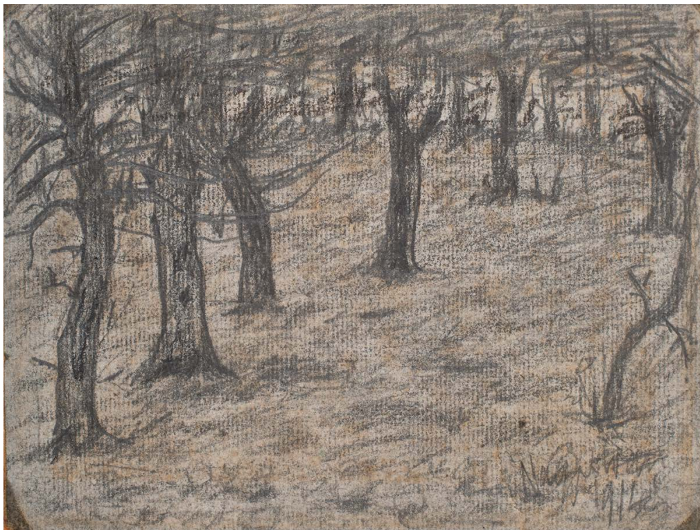
NAGY István: Erdőrszlet , 1914, ceruza, papír, 15×19,6 cm