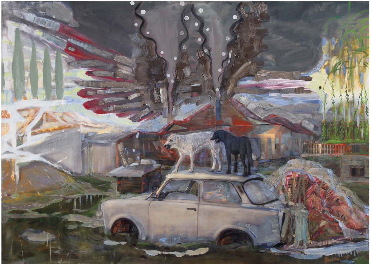
BUKTA Imre: Hajnalt ugató kutyák , 2018, olaj, vászon, 100×140 cm A művész jóvoltából →

tot ábrázoló, szürke koloritú műve ( Tavaszi kert , 2005) is talányos, zavarba ejtő, némiképp szürrealisztikus. Eltöprenghetünk azon, hogy vajon hogyan került a műanyag autó a fák koronája közé. (Az élmény ismerős lehet: vajon mit keres egy hosszú ruhás nő Giovanni Segantini egyik festményén egy ágas-bogas fa tetején?)