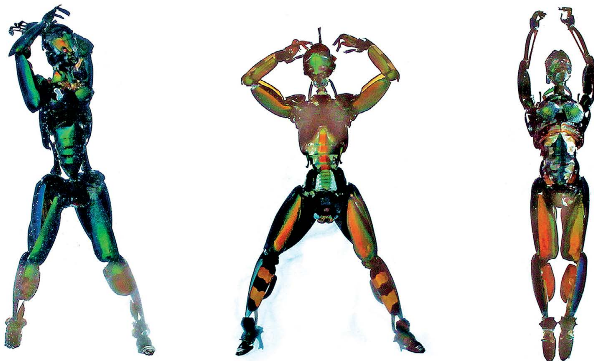
SZÖLLŐSI Géza: KITIN Project: Sorayama Fitness , 2020, trópusi bogarak, műgyanta, 40×30×8 cm A művész jóvoltából ←

vannak kulturális különbségek, de az alapminta evolúciósan determinált. Lehet toporzékolni és tüntetni, hogy „te is szép vagy, te sem vagy más”, de egyelőre a szépség genetikai beágyazottsága jó ideig nem fog változni. A baudelaire-i romlottság esztétikája ma már nem lázadás, hanem követelmény a művészetben. Létezik valami megmagyarázhatatlan, woodyallenes effekt, miszerint a szép testhez, archoz ostobaság (szóke nők viccek), korlátoltság (kidobóember-sztereotípiák) köthető. Sőt, a sport maga – a fitness, a body building és hasonlók – eleve gyanús,