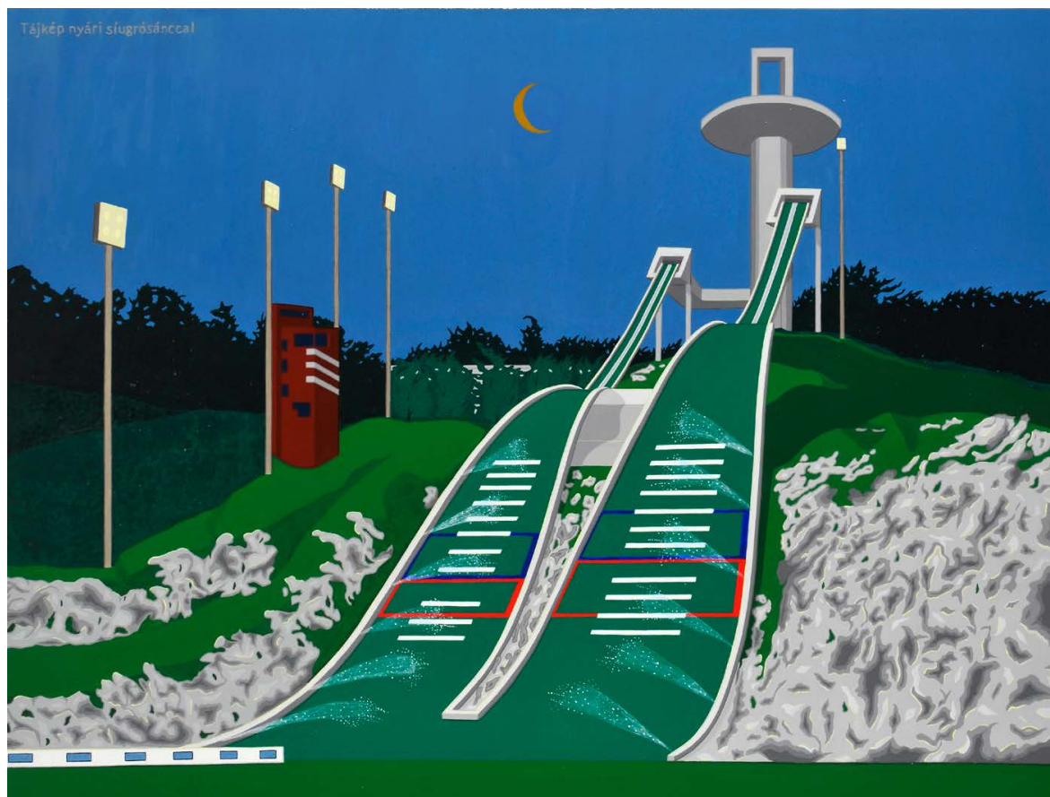
HECKER Péter: Tájkép nyári siugrósáncsal , akril, vászon, 100×130 cm →

ben az elvárásoknak megfelelően csúnya is legyen? Megoldásként olyan anyagokat használok, amelyeket nehéz kontrollálni, a végeredmény így képtelen klasszikus értelemben szép lenni, de valahol – remélhetően – mégis az. A Hajime Sorayama japán grafikus 80-as évekbeli robot pin-up girljeit felidéző bogárlányok, ahogyan egyensúlyozni próbálnak ízelt lábaikon, bizarr módon – a maguk módján – még bájosnak is mondhatóak. A figurák bágyadt tekintete, a gumibabák szájára emlékeztető potrohok és a nagy igyekezettel kivitelezett esetlen mozdulatok