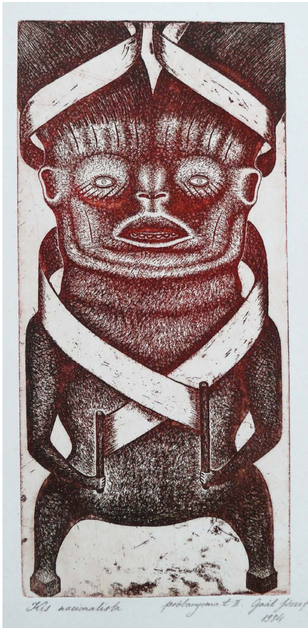
GAÁL József: Kis nacionalista , 1984, cinkkarc, 12×25 cm A művész jóvoltából →

azonosulásból nem lehet mélyebb átélésből fakadó, új hagyományt teremtő alap, mert a hagyománycentrikus művészetfelfogástól valójában viszolyg, nem ismeri és nem is akarja megismerni. A posztnemzeti teóriateológia hatására a politikai esztétika az általa nacionalistának tartott nemzeti közösséget, hagyományból építkező művészetet és művészt egyszerűen kirekesztő módon dehumanizálja. Természetesen a hungarofuturizmus csak apró, regionális láttele a múlt és a hagyományok kohéziós erejét kiiktatni akaró posztnemzeti politikai művészetnek, esztétikának. Veszélye, hogy a hagyományból fakadó művészetet is megfoszthatja szellemi önállóságától patológizációs módszerével. A „nemzetgép” gyártósora mellett kiszolgáló személyzetként, értékválasztási autonómia nélküli termelőként összemosódnak a különböző hagyományértelmezések alapján született művek. Ahogyan a politikában, úgy a kultúrában is az elegyítés stratégiájával, sokszor lényegi különbségek elhomályosításával hoznak létre tömböket két pólusra egyszerűsítve: progresszív internacionalista, ami baloldali és liberális, a másik pedig visszamaradt nacionalista és konzervatív. A politikai esztétika túl akarja lépni saját elméletein, de mivel a „nagy elbeszélések” ellenében jött létre, a felaprózó, dekonstruáló folyamatként működő, kvázi multikulturális működésképtelenségére csak a legrosszabb választ adhatja, a kételkedő önmegkérdőjeleződést. Illúzió,