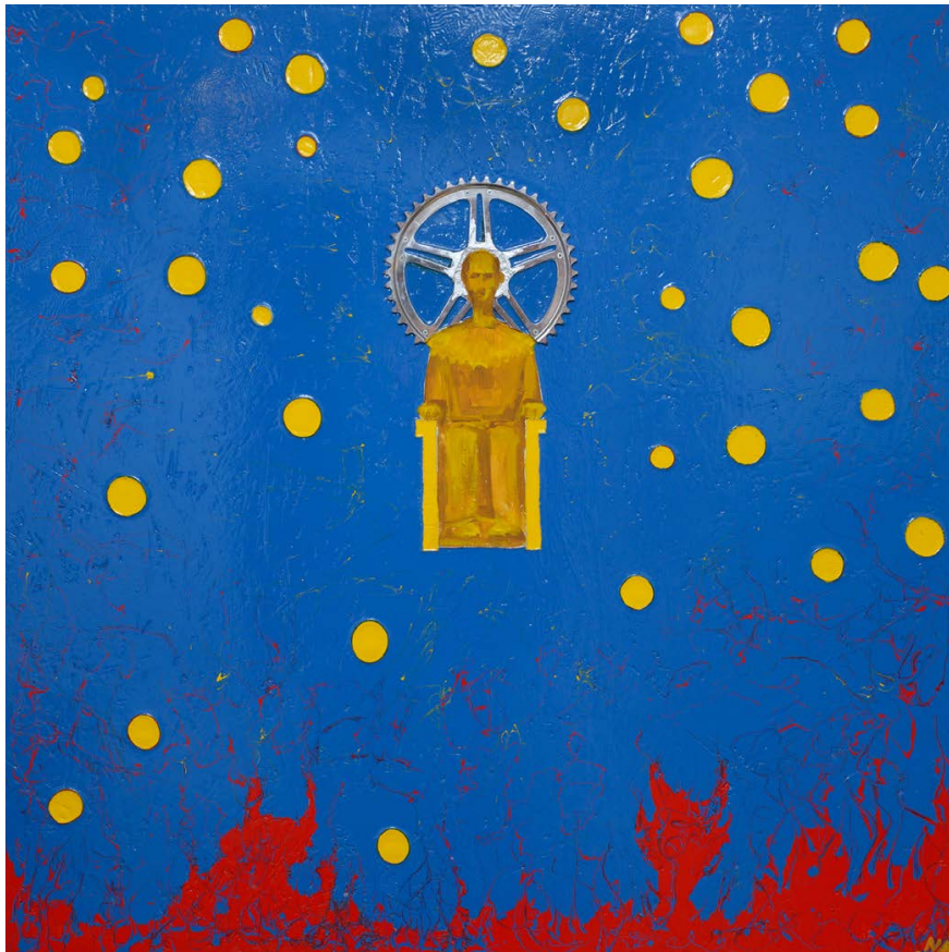
NEMCSICS Ákos: Harmonia caelestis , 2015, vegyes technika, préselt falemez, 95×95 cm ←

A kép alján, keskeny sávban látjuk a földi valóság sáttáni kísértéseinek vörös lángokban égő világát, amelyből átjutni az égi harmóniába lehetetlennek tűnik. A kiállítás egyik-másik képe ábrázolja a létrát is, amelyen át ez a fel-emelkedés megvalósítható: Az ég szféráinak fényeiben a szárai kitágulnak, kinyílik a Paradiso. Ez a felfelé mutató, fénylő létra ragyogása.