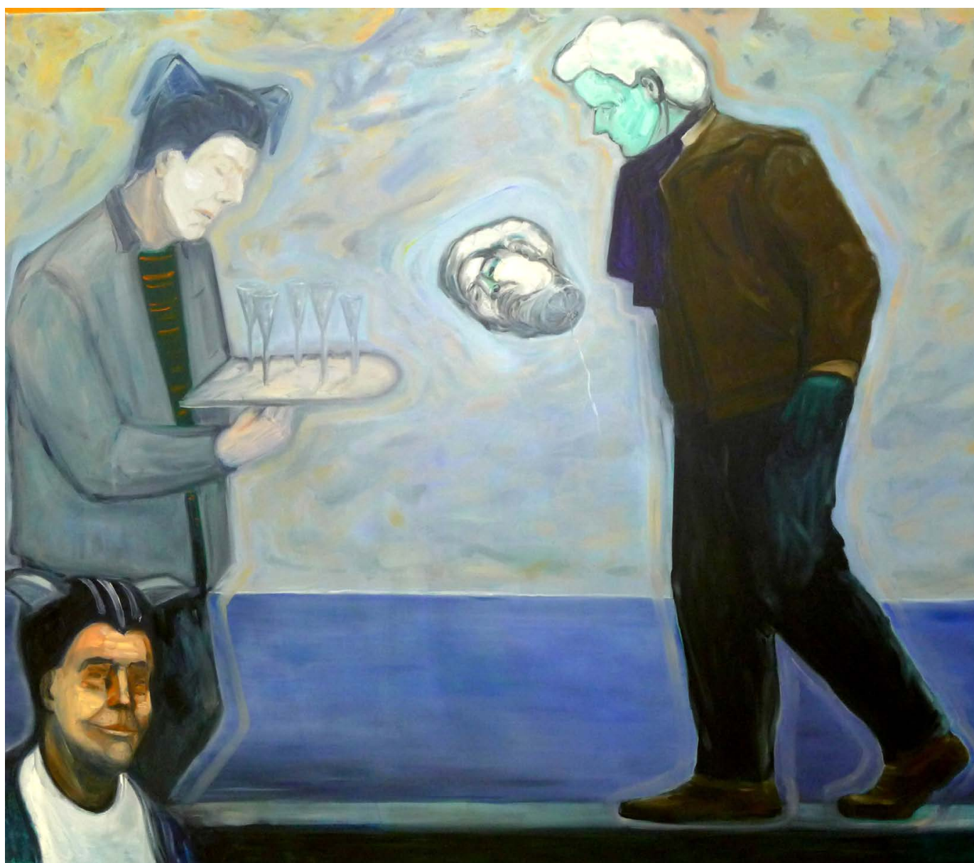
SEBESTYÉN Zoltán: Az ötödik... , 2021, olaj, vászon, 150×170 cm A művész jóvoltából ←

címadásakor is így jár el, hiszen azok inkább belső monológok első szavai, mintsem irányadó leírások. Az utánuk kitett három pont jelzi a történet narratíváját: a képek nézői továbbgondolhatják a festményeket, azok dekódolása a szemlélőre van bízva. A művek most is ábrázolók, mindig figurálisak. Emberalakjai ugyan valósnak tűnnek, a reáliából eredeztethetők, ám a körük telepített szövegkörnyezet már teljesen irreális, a művészi képzelet területehez tartozó. A figurák kontúrjait védő, kanyargó vonalak