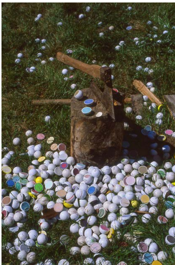
KRISTÓF Gábor: Cut the balls! 2020, változó méretek

Kristóf Gábor egyéni kiállítása Schemnitz Galéria, Selmezbánya, 2021. március 28-ig