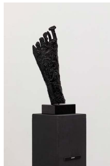
GERHES Gábor: Arbeit , 2021, fenyő, szilikonpaszta, akrillakk, 41×20×3,5 cm

Gerhes Gábor egyéni kiállítása acb Galéria, 2021. március 26-ig