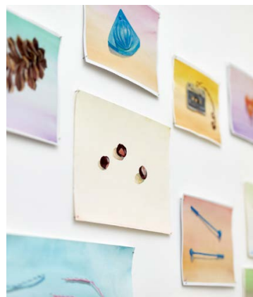
FISCHER Judit: Ami szép, az szép , kiállítási enteriőr, Kisterem, 2021

Fischer Judit egyéni kiállítása Kisterem, 2021. március 19-ig