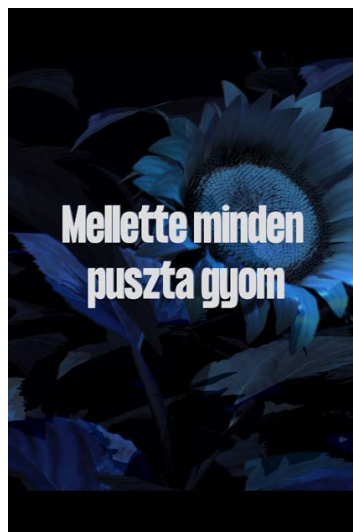
SÜVEGES Rita: Mellette minden puszta gyom , 2021

Süveges Rita kiállítása INDA Galéria, 2021. április 2-ig