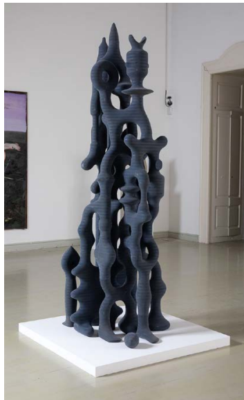
MELKOVICS Tamás: Blue kit , 2020, tömbösített és faragott MDF-lemez, 60 elemből felépülő, változó méretű kompozíció

Műcsarnok, 2021. március 2. – április 4.