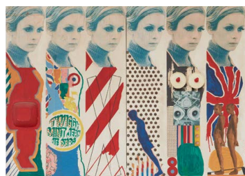
KEMÉNY György: Twiggy mint Jeanne d'Arc, 1967, fa, wallkyd, újságpapír és tárgyak, 71,5×100×1 cm

Laokoón, Jeanne d'Arc, Oppenheimer, Robert Kennedy és Twiggy találkozására 1968-ban Budapesten, Kemény György Fészek Művészklubban rendezett kiállításán került sor. A bemutatott anyagban Kemény a rá jellemző humorral és játékosággal művészettörténeti, történelmi és kortárs utalásokat dolgozott fel a pop-art stílusbeli és formai jegyeinek virtuóz alkalmazásával, vizuálisan könnyed hangvétellel – sajátosan európai, illetve közép-európai szemlélettel ötvözve esetenként súlyos témákat. A kiállítás ennek köszönhetően is a pop-art nemzetközi recepciójának kiemelkedő állomása, amely egyúttal a korszak hazai kontextusában úttörő – és a fejlemények tükrében sajnálatos módon megismételhetetlen – esemény volt. A Vintage Galéria kiállítása ebből az anyagból mutat be változást.