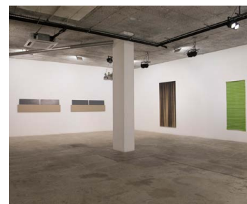
Kiállítási enteriőr, Godot Kortárs Művészeti Intézet, 2021

Károlyi Zsigmond és a „monokróm festőosztály” Godot Kortárs Művészeti Intézet, 2021. április 15-ig