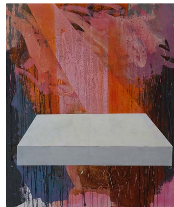
F. BALOGH Erzsébet: Titok , 2019, akril, olaj, vizespác, 140×120 cm

A „hazatérés” sokszínű, tág fogalom. Utal a festészetben megtett útra, melynek során a belső érés folyamatát követhetjük nyomon az indulati gesztusfestésztől a geometrikus rend felépítéséig megtett úton. A kiállítás betekintést ad a valóság értelmezésének egy sajátos formájába, melyben az alkotási folyamat, a festészeti anyagból kibontakozó keletkezés kerül a fókuszba. Ez kísérletezéssel, kérdéssel, felvetésekkel és sokszor játékos szabadsággal ötvöződik. Tematikai szempontból a falusi és városi tájlemek geometriája meghatározó F. Balogh festészetében. A valóságélményeket kiegészítik a festék ösztönös használatából létrehozott konstrukciók. A művész az alkotás folyamatában tudatosan éli át a romlás és az építés anakronisztikus ellentétét.