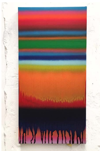
BÁNKI Ákos: Barcelona-sorozat , 2020, akril, vászon, 60×30 cm

Áradat, folyam, hömpölygés – az élethez nélkülözhetetlen víz megállíthatatlan mozgása és ereje. A víz, mely bennünk és körülöttünk állandóan jelen van, különösen, ha egy olyan folyó által kettészelt városban élünk mint Budapest, vagy ha időlegesen eltávolodva tőle olyan új otthont választunk magunknak, mint Barcelona, ahogy Bánki Ákos is tette, amikor tíz hónapra a tengerparti városba költözött. A K.A.S. Galériában megrendezésre kerülő Flūmen című kiállítás ennek a nem csak fizikai értelemben vett helyváltásnak, az eltávolodásnak és a visszatérésnek a passióját járja körül. Bánki Ákos a képtől eltávolodva, hozzá sem kézzel, sem ecsettel hozzá nem érve a vizet porrá őrölt festékszóróval permetezi vásznait, miközben tudata tökéletes kontrollt gyakorol keze, így a léggé vált víz felett.