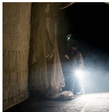
Kiállítási enteriőr, PINCE, 2021