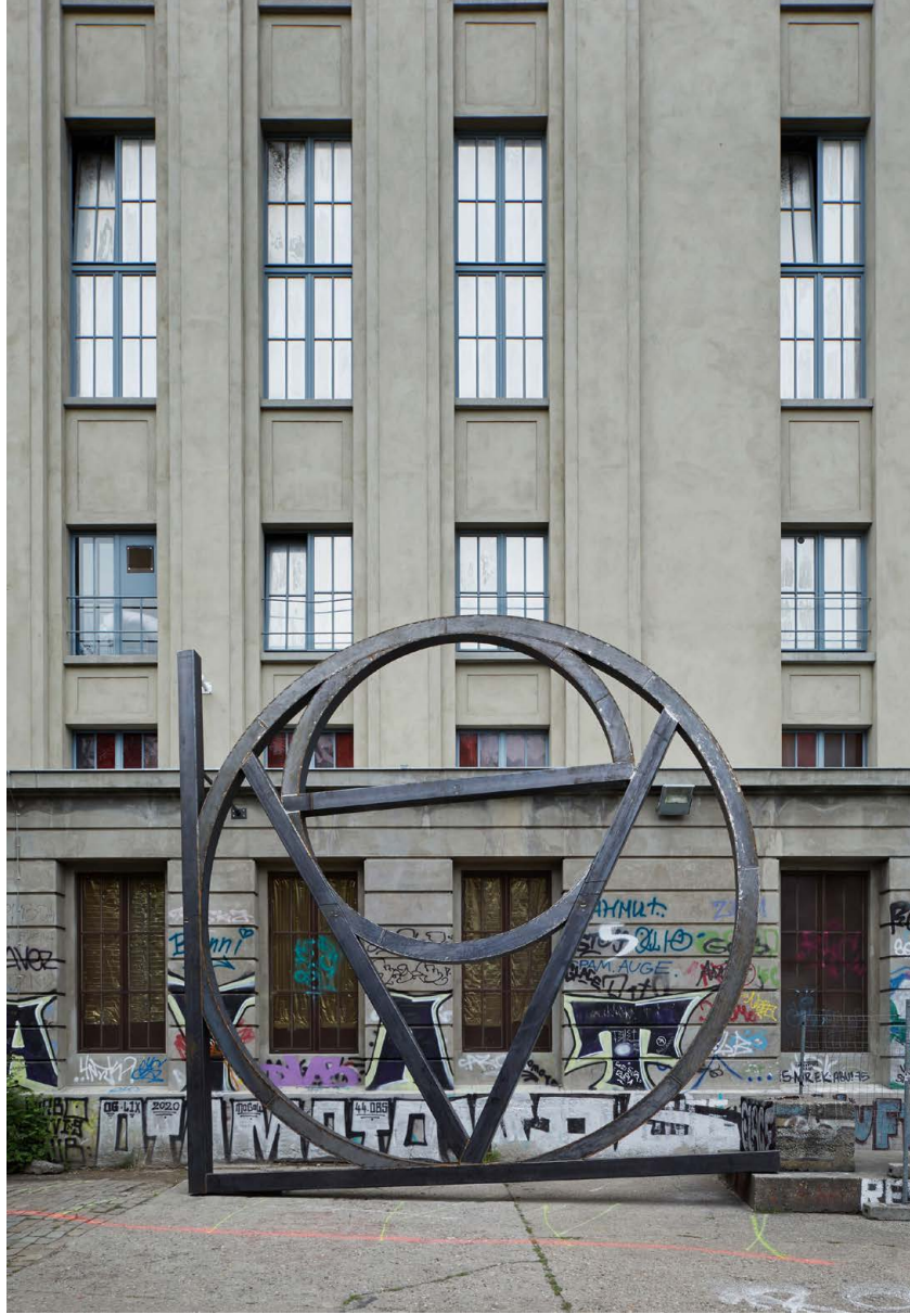
↑ DIRK Bell Love című féminstallációja, mely a szót alkotó négy összehegesztett betűből áll

tegethetetlen beengedőemberek válogatják az arra érdekeseket, s a várakozók legnagyobb részét magyarázat nélkül utasítják el. A rangidős beengedő, a fotós végzettségű (munkáival a tárlaton is szereplő) Sven Marquardt a berlini éjszakai élet ikonikus alakja. Marquardt nem lányregényekbe illő figura: arcát piercingek és ornamentális, töviseket ábrázoló tetoválások borítják, melyeket állítólag Mapplethorpe „szinte szigorúnak tűnő” virágai inspiráltak. A 70-es, 80-as évek Nyugat-Berlinének melegnegyede, Schöneberg egyik házfalán korábban egy hatalmas Marquardt-fej volt látható, a Vhils néven alkotó Alexandre Farto portugál streetart művész alkotása.