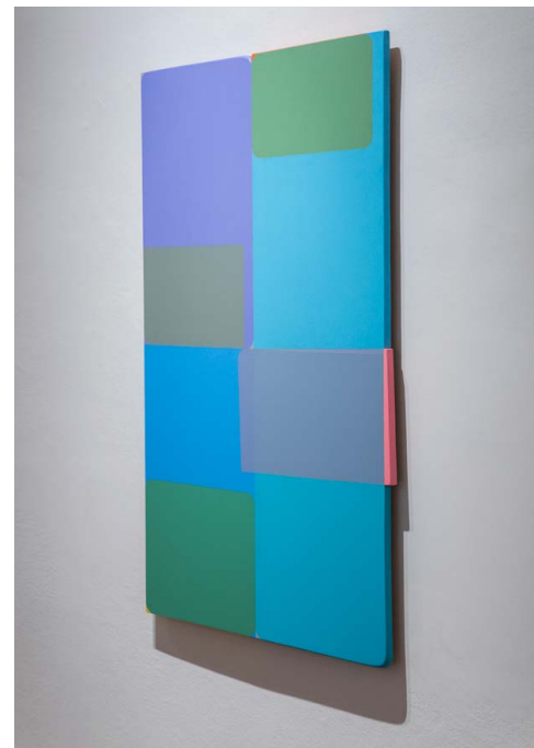
VARGA Bertalan: Légszomj. Alig formált 24. , 2019, akril, MDF-lap, 130×80 cm

„Igyekeztem egyfajta szükségszerűségre törekedni, a változatokat és lehetőségeket pedig egyszerre élvezni és rezignáltan tudomásul venni. Olyan képeket képzeltem el, amelyeken a színek és a vonalak nem elsősorban izgalmas konfliktusa, hanem egysége, egy töről fakadása van: egy olyan pont, ami szinte önmagától árasztja a gazdag sokféleséget és a formákat. A vonalat – melyről úgy éreztem, hogy az egy határozottabb értelmi gesztus – ettől kezdve mindig osztottságként, a színt pedig – amelyről úgy gondoltam, hogy az egyszerre érzelmes és érzéki, megfoghatatlanabb megjelenésforma – ezen osztottság nyomán létrejövő, szükségszerű változatokként képzeltem el. A lényeg, hogy a színek követik a vonalat, ami által a vonalak követik a színt. Ezt a paradoxont és komplementaritást akartam ábrázolni, és ezáltal minden stabilitást és kiindulást a munkáimból kiirtani. Egy műre a fogalmaim szerint akkor lehet azt mondani, hogy autentikus, ha stabil. Ami stabil, abban stabil pontot sehol sem találni: ez is csak egy komplementaritás.”