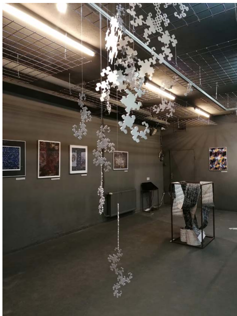
Kiállítási interiőr, FUGA, 2020

FUGA Budapesti Építészeti Központ, 2021. január 6–31.