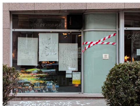
A Jedermann Café kirakata, Ráday utca

Budapest, IX. kerület, 2021. január 15-ig