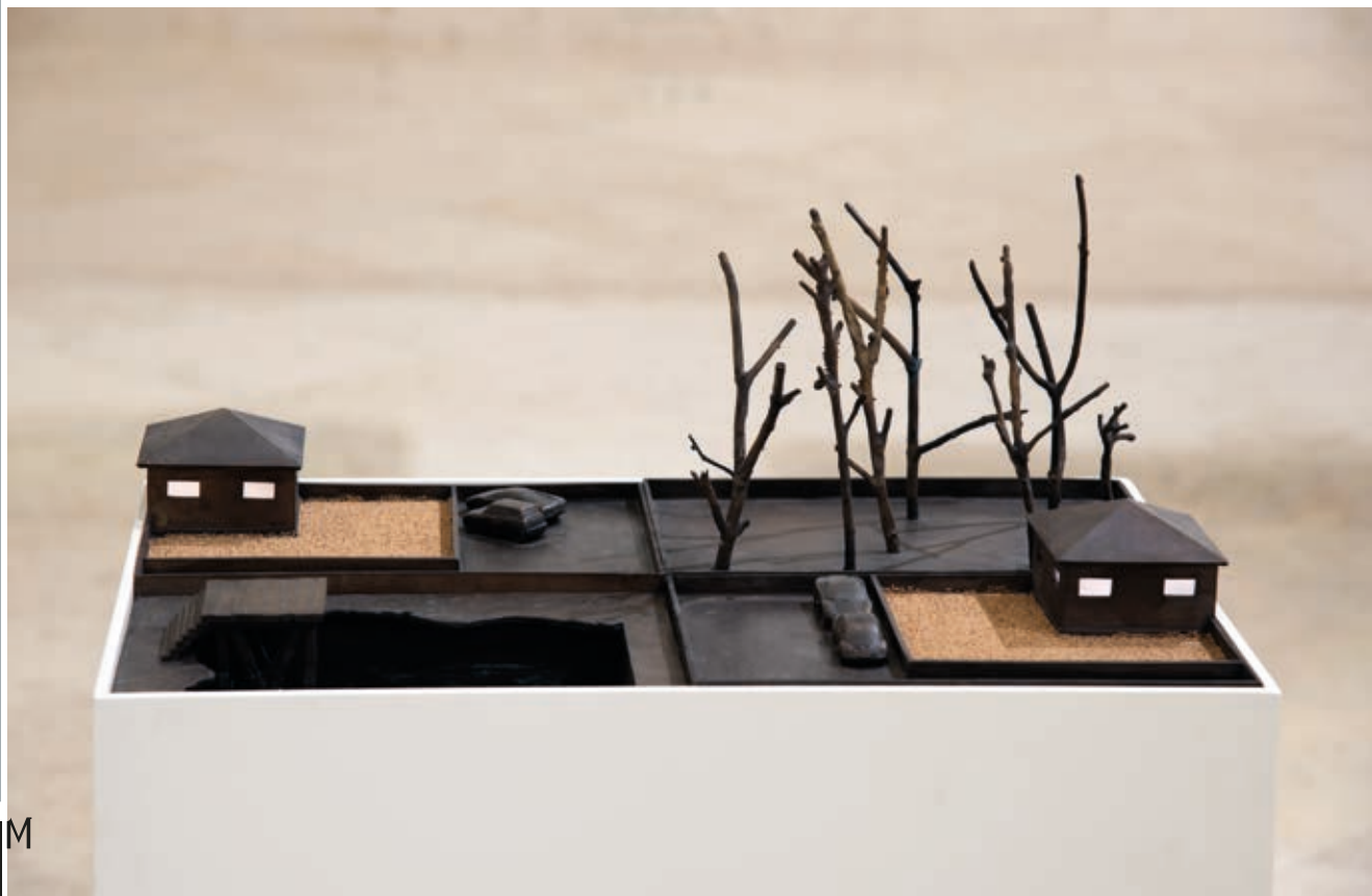
ZSEMLYE ILDIKÓ: Bronzvidék III. , 2018, bronz, víz, homok, 87×34×25 cm, HUNGART ©2020