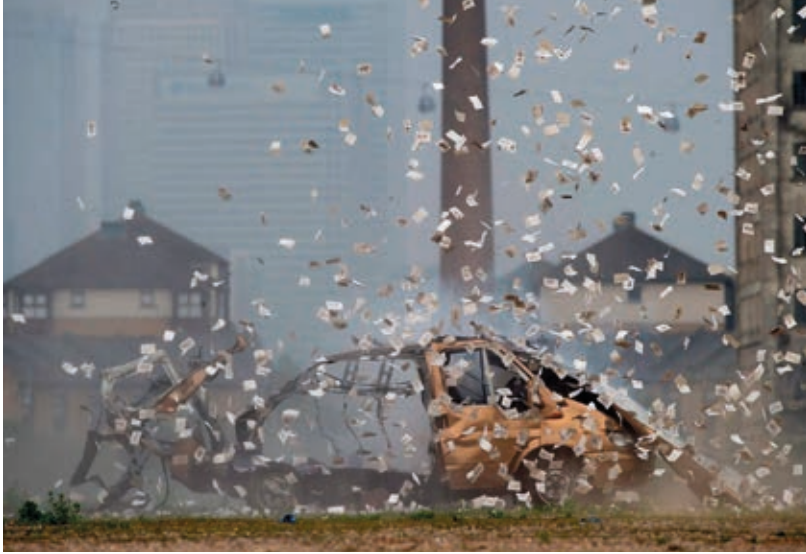
A Hilary Powell és Dan Edelstyn művészpár Big Bang 2 című akciója