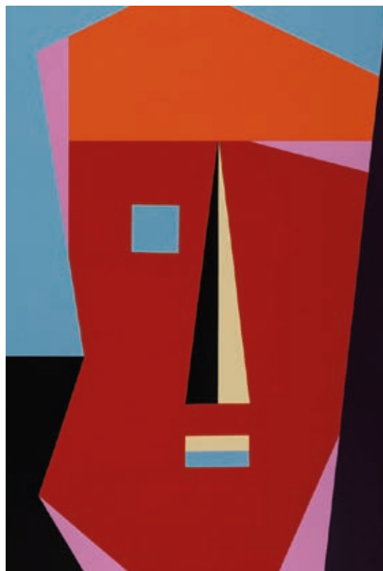
Bak Imre: Situation VI , 2020, akril, vászon, 140x210 cm, HUNGART ©2020