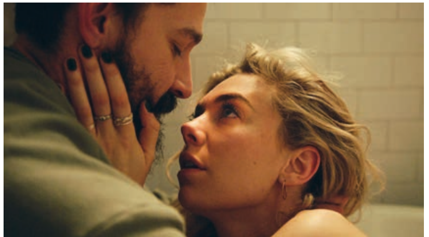
Részlet Mundruczó Kornél Pieces of a Woman című filmjéből