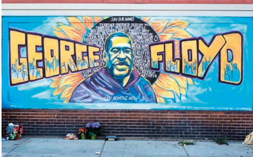
Black Lives Matter