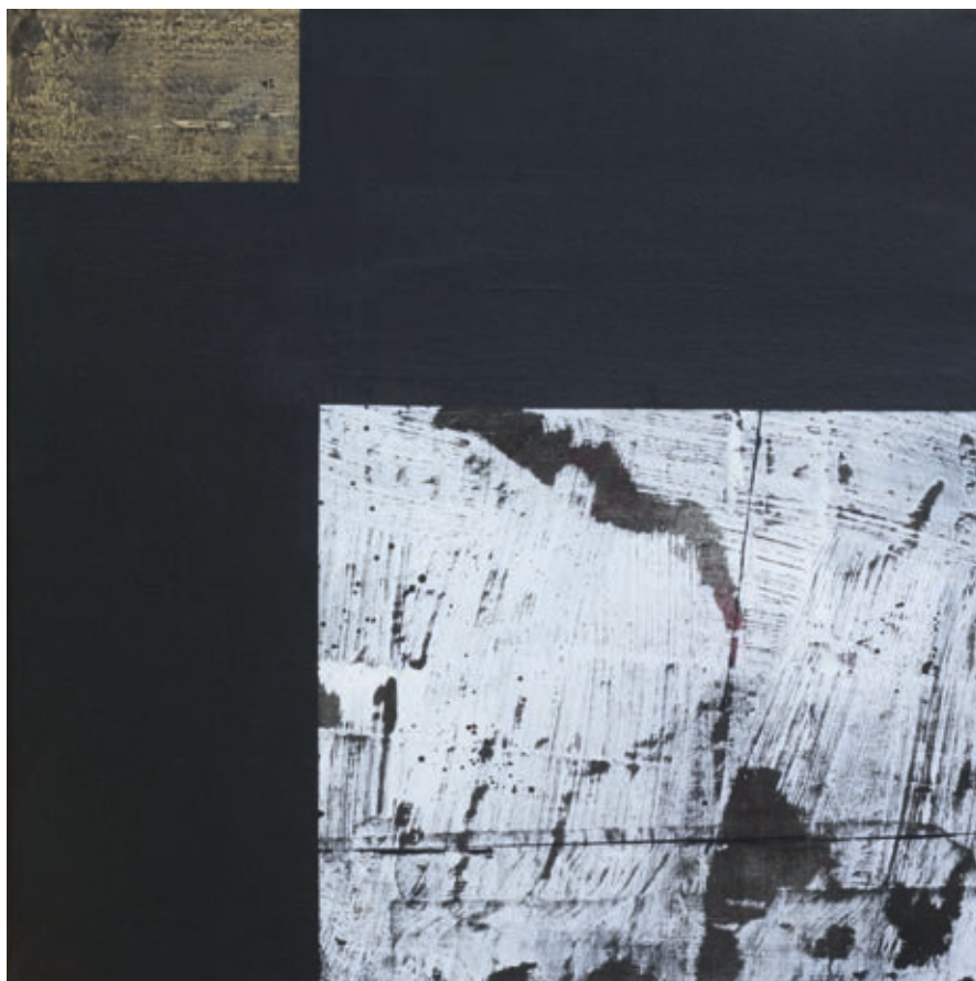
KÉRI MIHÁLY: Cím nélkül , 2018, akril, vászon, 50x50 cm HUNGART ©2020