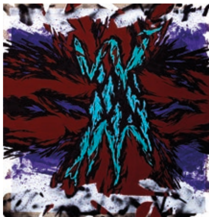
DÓCZY ATTILA: Powerformat No. 4 , 2017, tempera akrilspray, papír, 150×160 cm

Dóczy Attila legújabb, Fragments of Eternity című egyéni kiállítása a Powerformat -, a Shape of Noise - és Trophy -sorozataiból válogat. Munkái egy ismeretlen utópia fennmaradt darabjait mutatják, amelyben az installációk a távoli jövőben, mai világunk romantizált, újraértelmezett emlékeiként maradtak fenn. Ebben az elképzelt távoli jövőben a számunkra nem is annyira messzi rendszerváltás utáni időszak markáns esztétikai elemei élednek újjá – olykor a humoros hangvételt sem nélkülözve. Dóczy fesztelen anyag- és színhasználata hol merész eleganciát, hol súlyos iróniát csempész kompozícióiba. Munkáit a művészeti médiumok széles skálája közötti szabad átjárás jellemzi, installációi túlfeszítik a hagyományos műtárgy fogalmait. Az installatív munkák egy-egy kirakós darabjaiként jelennek meg egy távoli, felborult világrend utolsó mementőiként. Ennek a posztkapitalista teremtéstörténetnek a legfőbb stációi a státusz, a szexualitás és az egyre növekvő hulladékfelhalmozás.