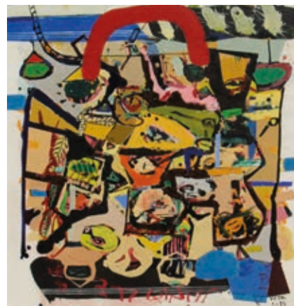
VÉGH ANDRÁS: Bőrönd , 2019, akril, vászon, 100×95 cm

Nagy, szabad lélegzetű vásznak és kisebb, visszafogottabb hangvételű képek is láthatóak a tárlaton, amely Végh András 80. születésnapja alkalmából nyílt meg. Végh 80 – lakonikus kiállítás címmel, mely gazdag és változatos életművet hivatott megjelölni. Ebből a nyolcvan évből, amely hatvanéves alkotásidőt feltételez, az utóbbi 12 év munkái láthatók most két kiállítóteremben. Nagy, szabad lélegzetű vásznak és kisebb, visszafogottabb hangvételű képek. Esszenciái, gondolati összegzései eddigi munkásságának – egyben iránymegjelölései elkövetkezhető korszakoknak. Valaki ezt a kérdést vetette fel Végh András művei kapcsán: a művész gondolja, látja-e szét a jelenségeket, vagy a jelenségek valóságban végbemenő dekonstrukcióját ragadja meg ráérző figyelemmel? A válasz a látogatásban fogalmazódhat meg." (Zalán Tibor)