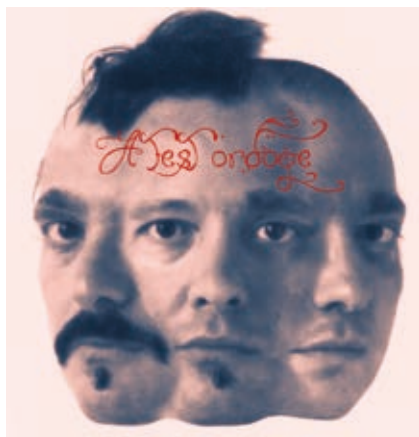
A kiállítás plakátja

Ez a téma meglehetősen régóta érdekli a művészeket, gondoljunk csak Hieronymus Bosch, Francisco Goya vagy Francis Bacon műveire – valamennyien sajátosan viszonyulnak a test, az erőszak és az élet-halál kérdéséhez. A test ördöge nem elsősorban az anyagában, hanem mondanivalójában 18-as karikás. A tárlat témája ugyanis a test kiszolgáltatottsága, ugyanakkor árulása, az anyag és a szellem kettősége és ellentéte, az ösztönök, a vágyak szabadsága és a morális értékek küzdelme.