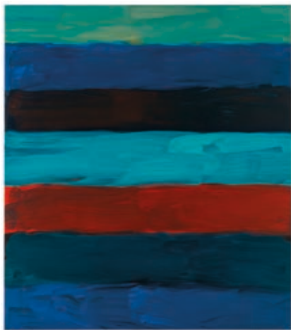
SEAN SCULLY: Oisín tengerzöld , 2016, olaj, alumínium, 216×190,5 cm, magángyűjtemény

A Szépművészeti Múzeum – Magyar Nemzeti Galéria a kelet-közép-európai régióban először mutatja be retrospektív igényrel Sean Scully életművét. Scully az absztrakció legfontosabb kortárs képviselői közé tartozik, akinek művészetét egyszerre jellemzi formai redukció és referenciális gazdagság, geometrikus építkezés és expresszív önkifejezés. Az 1980-as évektől sajátos képi nyelvet alakított ki, amely látszólag ellentétes minőségek kifinomult szintézisére épül. A kiállítás az életmű összes meghatározó periódusát áttekinti az 1960-as évek figurális kísérleteitől és az 1970-es évek minimalista formanyelvétől az 1980-as évek expresszív sávokból építkező alkotásain át az ablak- és falmotívumokkal asszociálható műcsoportokig. A mintegy száztíz Scully-művet bemutató kiállításon a monumentális festmények mellett megjelennek papírmunkák, plasztikák és fotóművek is. Külön szekciók foglalkoznak a művész olyan meghatározó alkotókra vonatkozó reflexióival, mint Vincent van Gogh és Pierre Bonnard. Scully művészetének perspektívájából szemlélve a festészet történetére és a klasszikus alkotásokra is másképp tekinthetünk.