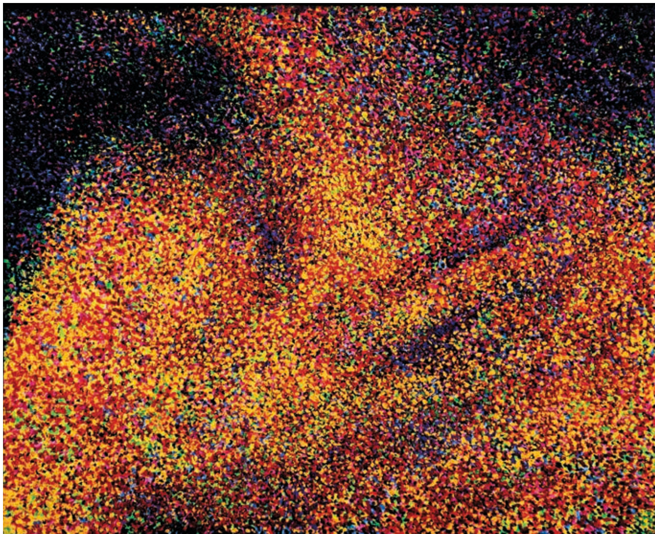
BENYOVSZKY-SZÜCS DOMONKOS: Kéztanulmány (Konstelláció) , 2019, olaj, vászon, 52×42 cm

B-SzD: Inkább a változásról és annak érzékeléséről. Ebben a munkában a múltból származó képek és a jelen ütköztetésével a személyes időérzékelést tematizáltam. A nagymamám arcára vetítettem a fiatalkori képeit, majd újrafotóztam azokat. Bár többféleképpen állítottam ki korábban, a mű végső formája a lentikuláris print lett. A kép előtt sétálva a felszínen a múltból származó arcvonások változnak, míg az igazi arc, a projekciós felület változatlan marad. Ehhez a sorozathoz készítettem egy videót is, amelyben a nagymamám arca folyamatosan változik, de nem tudod tetten érni, hogy pontosan mikor. Ahogy szinte lehetetlen észlelni a változást a mindennapok során, csak utólag válik megkerülhetetlenné.