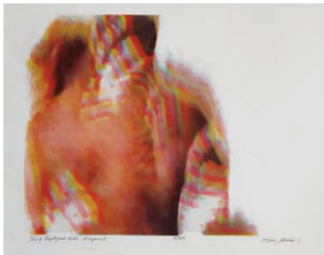
BENYOVSZKY-SZÜCS DOMONKOS: Iris – Zephyrus (Metamorphosis) , 2020, risoprint, 50x40 cm