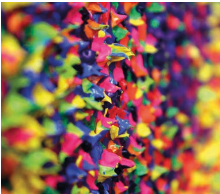
Konstelláció I., részlet

kortárs színtéren is. Mindeközben az egész egyfajta korszerű TIT-előadás vagy szórakoztató művészettörténet.