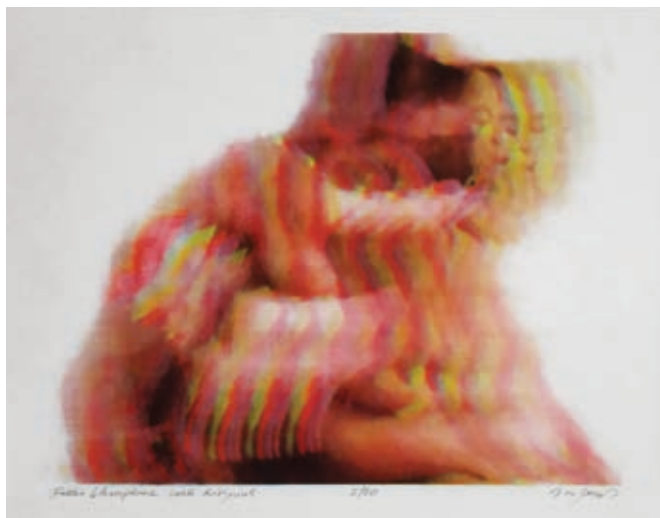
BENYOVSZKY-SZÜCS DOMONKOS: Hades – Persephone (Metamorphosis) , 2020, risoprint, 50x40 cm

De igazad van abban, hogy újra és újra előveszem valamelyik témámat. Mindegyiknél úgy érzem, érdemes továbbvinni, éppen ezért találónak érzem a rétegzettséget mint kulcsszót magammal kapcsolatban. Szeretem a létezés komplexitását, és mindig újabb és újabb rétegeit fejtem fel. Az pedig, hogy a festészet anyagsága és érzékisége szintén érdekel, szerintem nem meglepő egy festő esetében.