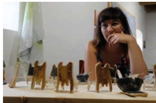
Szabadkéz Művésztelep, Szihalom