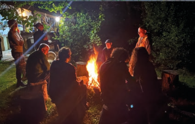
Nyílt Tér Művésztelep, Mezőszemere