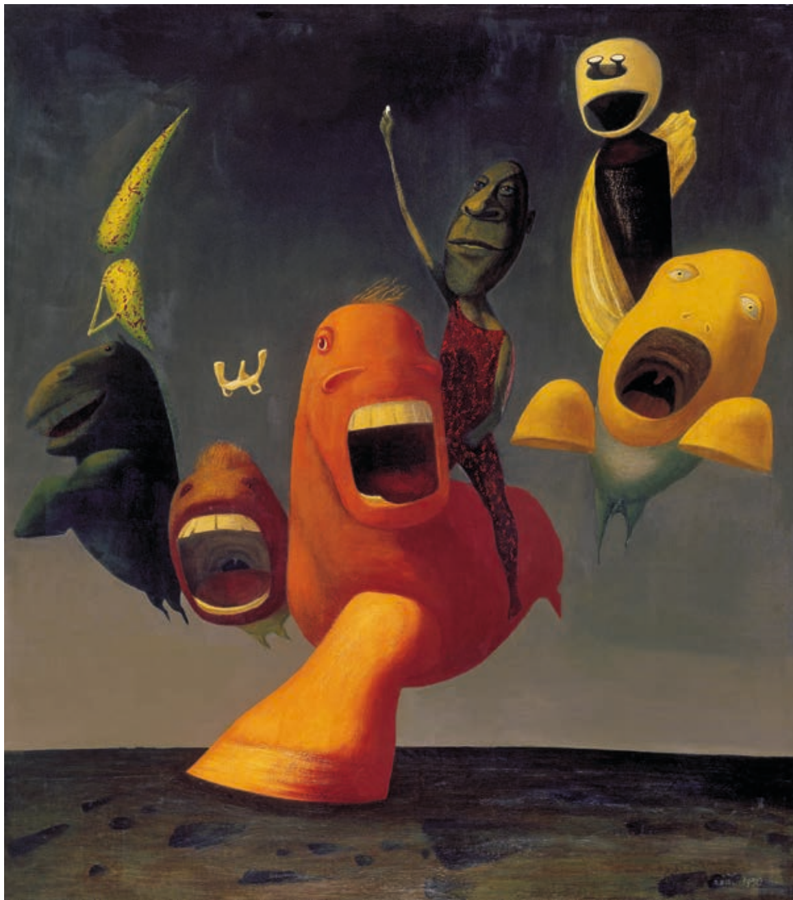
REIGL JUDIT: Csillapíthatatlanul szomjazzák a végtelent , 1952, olaj, vászon, Pompidou-gyűjtemény, a Kálmán Makláry Fine Arts jóvoltából

gyönyörű képe a Sotheby's-nél, az 1960-as M.A. 4 , amelyet leütési illetékekkel együtt 560 ezer euróért adtak el. Ez volt magasan a legdrágábban eladott Hantai-kép a művész életében. Egy párizsi galériás vette meg. 2015-ben ugyanazt a képet ugyanannál az aukciós háznál újraárverezték, ekkor már 4,4 millió euróért ment el. Befektetésnek sem volt utolsó. Eddig Reigl legdrágább képe publikusan 412 ezer euróért talált gazdára szintén a Sotheby's-nél, de privát eladásban ennél drágábban is kelt már el alkotása. Ilyen árat nem sok művész élhet meg életében. Ők megélték.