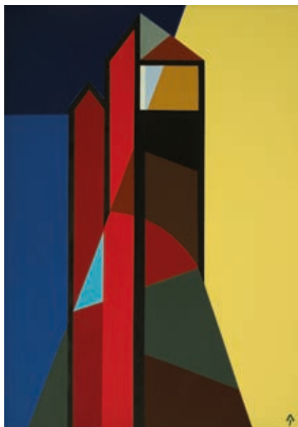
AKNAY JÁNOS: Emlék II. , 2019, akril, vászon, 100×70 cm

A művészi önkifejezést vizsgálva öt olyan szempont alapján lehet csoportosítani a képzőművészeket, ami felmutatja alkotói üzenetüket. Megtalálhatók az organikus megközelítés hívei, akik az irracionális dolgok, a képzelet, a belső táj ihletettségében hoztak létre munkákat. Vannak a konstruktív felfogás, a racionális világ értelmezését követők, akik a struktúrában való gondolkodást helyezik előtérbe. Harmadikként az éteri, spirituális világ összefüggéseit boncoló alkotókat sorolhatjuk. Jelen vannak az ösztönös hevület, a gesztust síkban és térben megjelenítő kiállítók. Ötödikként láthatunk figurálisnak mondható kompozíciókat szimbolikus áthallásokkal.