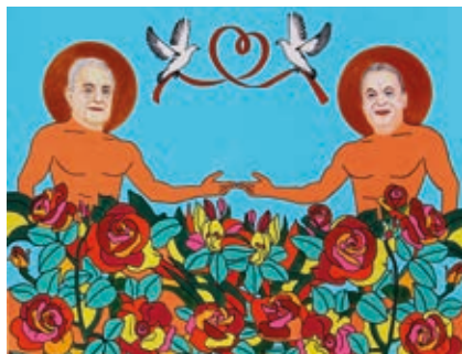
DRMÁRIÁS: Soros György és Orbán Viktor békét kötnek, hogy együtt virágoztassák fel Magyarországot, amiért jutalmul a mennybe jutnak , 2020, akril, vászon, 80×100 cm

Tárlatvezetés a művésszel: szeptember 18-án 18:00 órák. Kerekesszékkal is látogatható!