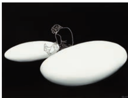
FEHÉR LÁSZLÓ: Kavicsokon , 2018, olaj, vászon, 150x200 cm