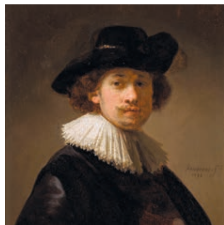
Rembrandt van Rijn: Önarckép csipkegallérral és fekete kalappal, 1632, olaj, fa, 15×20 cm