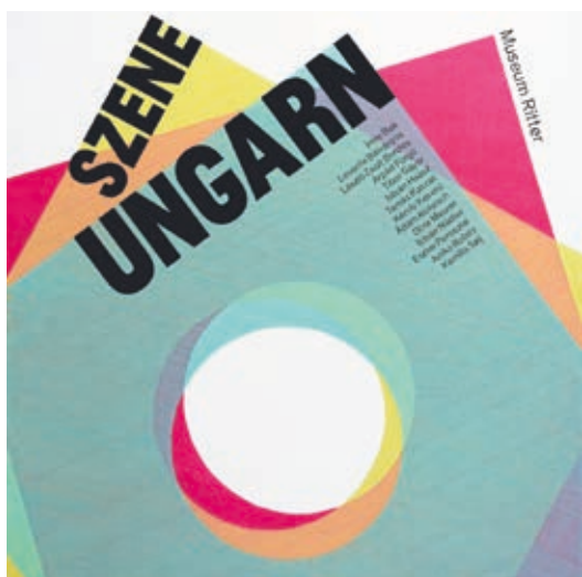
A Szene Ungarn plakátja