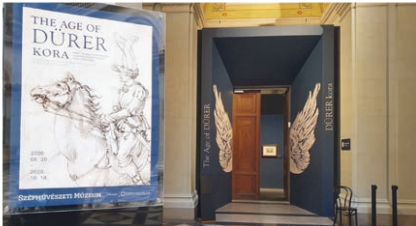
Dürer kora a Szépművészeti Múzeumban

Az 1888-ban kézzel írt, négyoldalas levél címzettje Émile Bernard francia festőművész, a posztimpreszionizmus egyik kulcsfigurája. Van Gogh és Gauguin 1888 novemberében vetették papírra a levelet a franciaországi Arles-ban, ahol február óta tartózkodott a holland festő. A levél leütési árát 180 ezer és 250 ezer euró (60–84 millió forint) közé becsülik a szakértők. A két művész egyebek között a bordélyházakban tett látogatásairól és éppen készülő alkotásairól mesél a levélben.