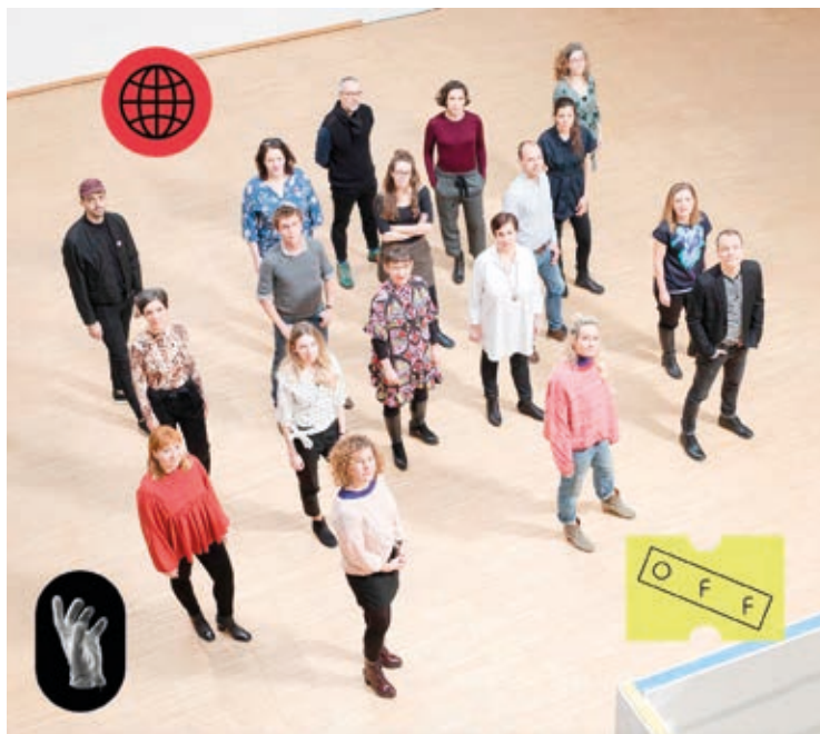
Az OFF Biennálé csapata

Az OFF Biennálé Budapest meghívást nyert a világ egyik legfontosabb kortárs művészeti eseménye, a documenta 2022-es kiadására, amelyet a németországi Kasselben rendeznek meg öt évente. Az úgynevezett „nemzetközi lumbung” kezdőcsapatába nyolc másik szervezettel együtt hívták meg az OFF-ot, melyet az elmúlt években a világ minden szegletét bejárva választott be az együttműködésbe a documenta művészeti vezetése.