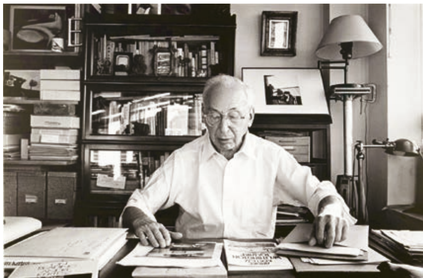
André Kertész

A magyar kormány bejelentette, hogy az év végéig megvásárolja a magyar származású André Kertész fotóművész felvételeinek – pontosabban meg nem határozott – gyűjteményét a New York-i André and Elizabeth Kertész Alapítványtól. A bejelentés szerint a magyar állam legfeljebb bruttó 6,1 millió dollárt szán az üzletre.