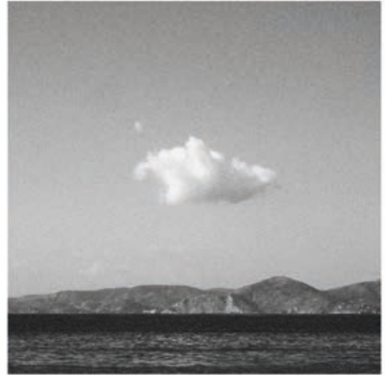
MUCSY SZILVIA: Palm, Sea, Land, Alimos, Athén, Görögország, 2016, 23x23 cm

A természet és az ember kapcsolatának fontos helye a tájkép. A tájkép műfaja olyan információkat tárol a keletkezési koráról, amelyek nem csak a művészeti érdeklődést keltik fel. Tanúskodik egy korszak világgképéről, működéséről és társadalmi berendezkedéséről. A 17. századi holland tájképek kultúrtörténeti és társadalmi jelentőségéről írt Svetlana Alpers ( Hű képet alkotni , [1983] 2000): a képeket a világ megismerésének technikai feltételei (mikroszkóp, teleszkóp) alapján vizsgálja. Központi szerepet kap a camera obscura, melynek segítségével mechanikusan tudták megörökíteni a világ látványát, és amelyre a fényképezés előzményeként tekintünk vissza. Alpers idén ősszel megjelenő könyve