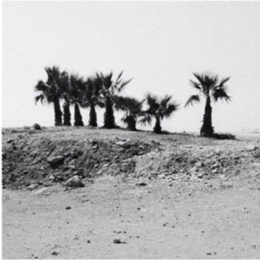
MUCSY SZILVIA: Palm, Sea, Land, Glyfada, Athén, Görögország, 2016, 23x23 cm

A természet és az ember kapcsolatának fontos helye a tájkép. A tájkép műfaja olyan információkat tárol a keletkezési koráról, amelyek nem csak a művészeti érdeklődést keltik fel. Tanúskodik egy korszak világgképéről, működéséről és társadalmi berendezkedéséről. A 17. századi holland tájképek kultúrtörténeti és társadalmi jelentőségéről írt Svetlana Alpers ( Hű képet alkotni , [1983] 2000): a képeket a világ megismerésének technikai feltételei (mikroszkóp, teleszkóp) alapján vizsgálja. Központi szerepet kap a camera obscura, melynek segítségével mechanikusan tudták megörökíteni a világ látványát, és amelyre a fényképezés előzményeként tekintünk vissza. Alpers idén ősszel megjelenő könyve