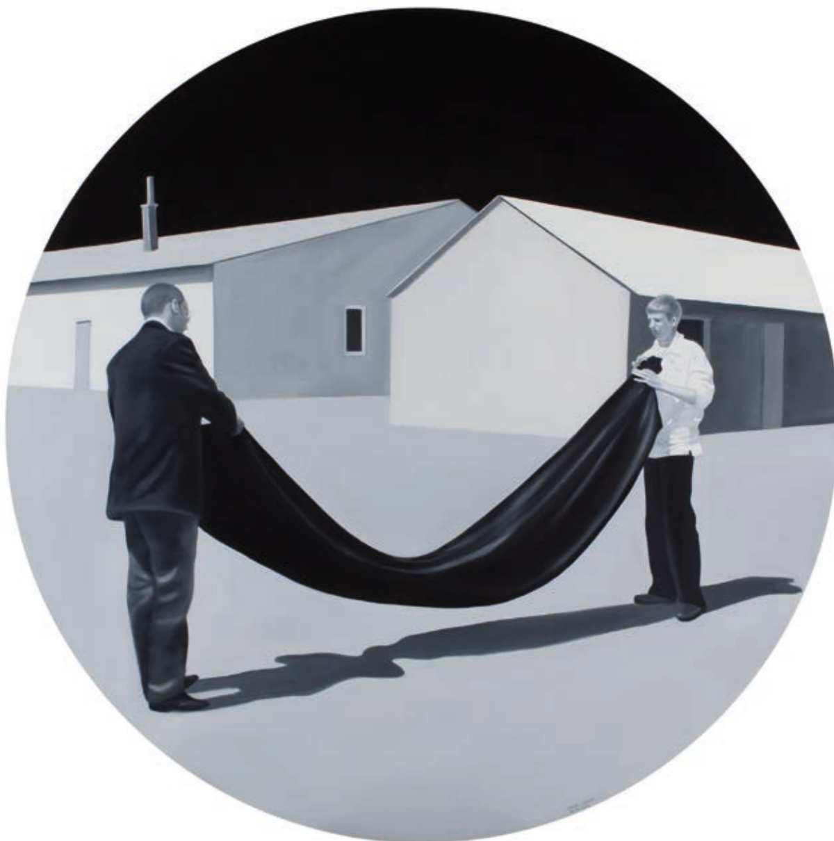
FEHÉR LÁSZLÓ: Fekete lepel , 2011, olaj, vászon, Ø 200 cm, HUNGART ©2020