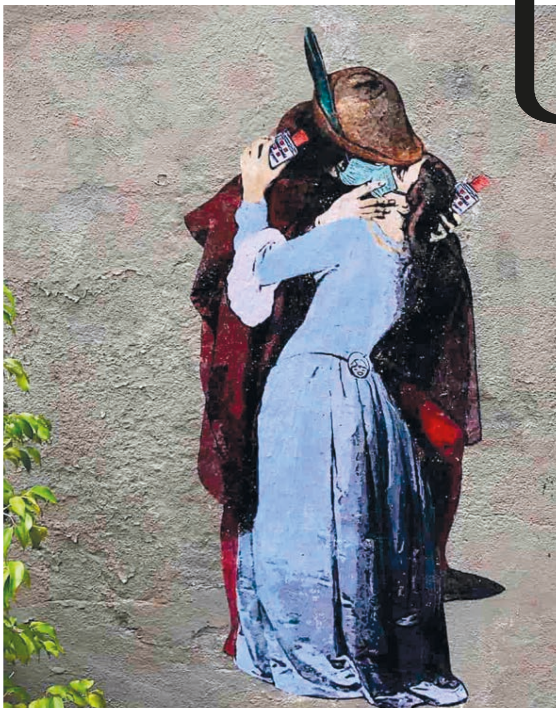
TUBOY: Hayez csókja a járvány alatt , 2020, stencil

Míg a cirkuszok és az utazó szórakoztatóipar évi 5 milliárd eurós állami támogatást élvez, az olasz művészet versenyképessé tételére fordított erőforrások igen szűkek. Pedig a kulturális szcénában nem érvényesek a kereskedelmi vagy szolgáltatási szféra indikátorai. A kultúrával kapcsolatban nem az elégedettségi fok a mérvadó, hanem az a kérdés, hogy a kínálat megfelel-e a keresletnek. A kultúra iránti igényt elsősorban a kínálatnak kellene megteremtenie. Vegyük a zene esetét. Olaszország a romantikus operák hazája. A kortárs