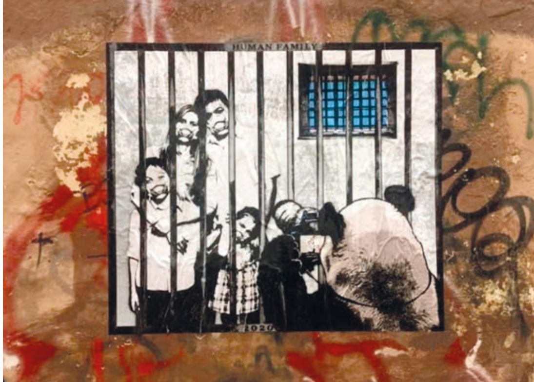
HARRY GREB: Human family , 2020, falfestés, Trastevere, Róma

zenére nincs spontán igény, ennek kialakítását ezért segíteni kell, például a belépőjegyek csökkentésével vagy ingyenessé tételével.