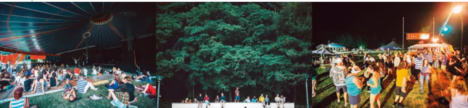
Bánkitó Fesztivál, 2019