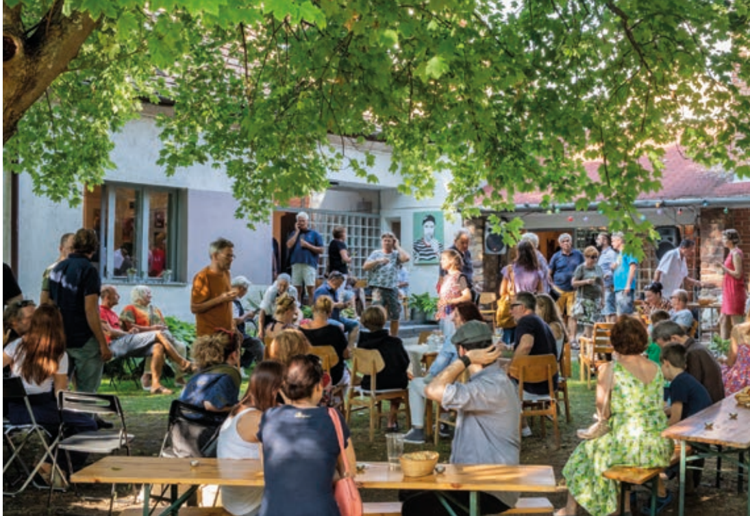
ResidentArt Garten, 2019, Lovas

A karantén kihirdetését követő első pár hétben hihetetlen kreatív energiák szabadultak fel, a művészek átértelmezték az online felületeket, mindenki elkezdett alkotni, a műtermek és az alkotói terek bekerültek a lakásokba, a festők festettek, a filmesek karanténfilmeket gyártottak, olyan témákat találtak, melyekhez nem kellett kimozdulni a lakásból. Kreatív szellem lengte be az online teret. Egy idő után, nagyjából mostanra, az inga kilengett a másik oldalra, elérkezett a demotiváltság és a kiégés. Túl sok lett az inger, és komfortosabbá vált befelé figyelni, lecsendesedni, korlátozni a médiafogyasztást. Időközben kérdésessé vált az ingyenes tartalom gyártása is: ha ingyen adom, amit tudok, nem válik-e értéktelenné? Illetve hogyan fognak érte később fizetni? Az elmúlt két-három évben erősödött a gyűjtői érdeklődés a kortárs képzőművészet felé, vajon lesz-e erőforrásuk a jövőben vásárolni? Tönkremennek-e a galériák? Lesznek-e pályázatok, ösztöndíjak, residencyk? Mit okoz a kulturális területen a gazdasági visszaesés?