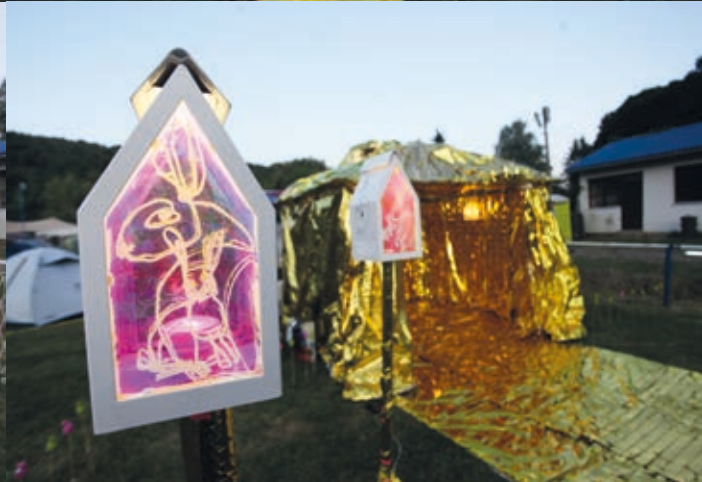
HOLY OLGA installációja a Bánkító Fesztiválon, 2019