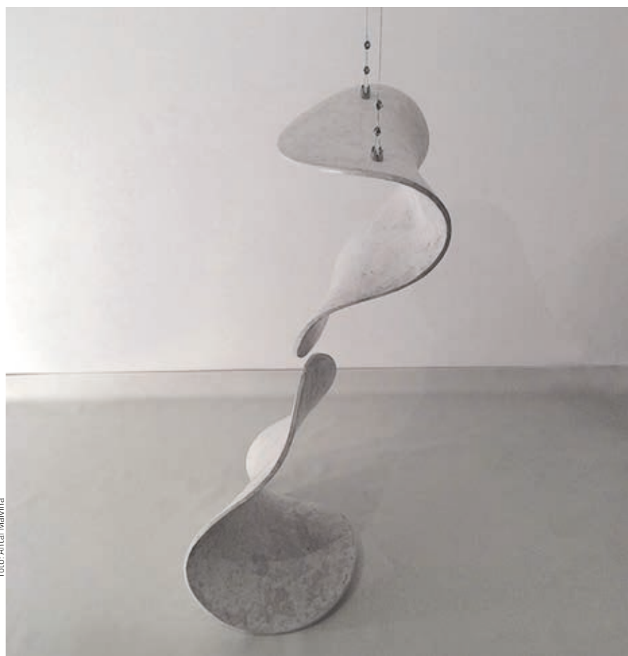
Fotó: Antal Malvina

Munkásságának fontos része műveinek tere, ezek kiválasztása, a helyspecifikusság. MMA-s programjában ezt így határozza meg: „A szobor tere, illetve a térben elfoglalt helyének gondolata olyan kiindulópont, ami munkáim egyik kardinális kérdése. Könnyű és nehéz, mozgó és mozdulatlan, a világ eleje, a világ köldöke, a világ mélye.” Így fogalmazza újra és újra Antal Malvina munkáiban a nagy kérdéseket.