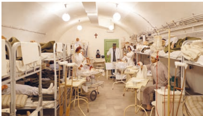
A Sziklakórház Atombunker Múzeum egyik terme