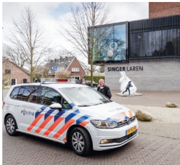
Singer Laren Múzeum

A tolvaj A nueneri paplak kertje 1884 tavaszán című festményt vitte magával, melyet a Groningeni Múzeum adott kölcsön egy időszakos kiállításra az Amszterdamtól keletre, Laren városában található múzeumnak. Az enyveskező ismeretlen egy kalapáccsal zúzta be a koronavírus-járvány miatt zárva tartó intézmény ajtaját. A betörő több ajtón és többretegű, szakértők által is jóváhagyott védelmi rendszeren hatolt keresztül, ezért a közzétett felvételekből nem lehet következtetést levonni a múzeum biztonsági rendszerének minőségéről.