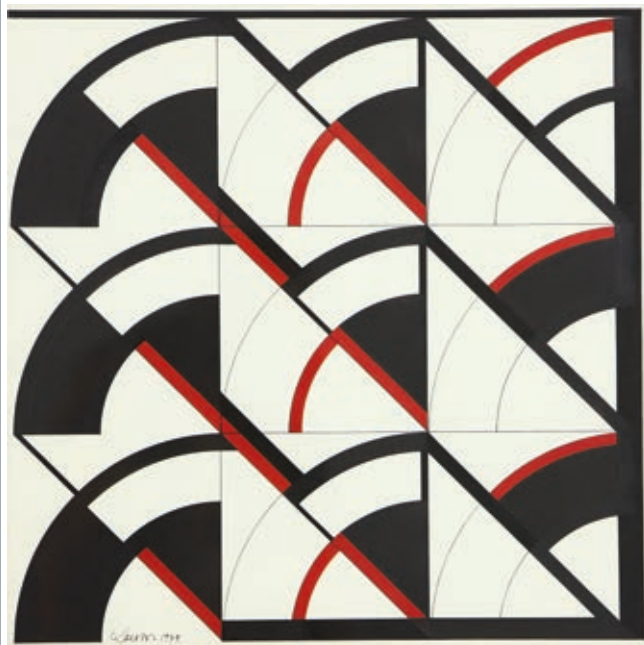
LANTOS FERENC: Elemek , 1979, tus, papír, 50x50 cm HUNGART ©2020

kutatás kell felváltsa az egyéni intuíciót és kifejezőmódot.” Pár évvel később, a negyedik NT eseményen Abraham Moles a tudományos kísérlet elveit hangsúlyozta: „A kísérletezés a lehetőségek rendszerezése, valamint feltárása, és alapvetően más, mint a próbálgatás. Amit az elmúlt húsz év művészetében láttunk, az mind próbálgatás volt és nem komoly elemzés. [...] A kísérletezés egy algoritmikus feladat [...]” Tehát a tudomány és a művészet folyamatai a kísérletezésen át függenek szorosan össze. A hagyományos művészetet a trial-and-error próbálgatásos elvét követi, szemben a tudományos kísérlet következetességével, megismételhetőségével és szigorúságával. A kísérlet módszertana alapvetően eltér a „spontán művészi génusz” intuíción alapuló önkifejezésétől. Azonban Moles folytatja: „A művész többé már nem manuálisan kezeli a tárgyakat és színeket, hanem algoritmusokat használ, amelyek szükségképpen absztraktak [...]” Lantos ezeket az akkor formálódó,