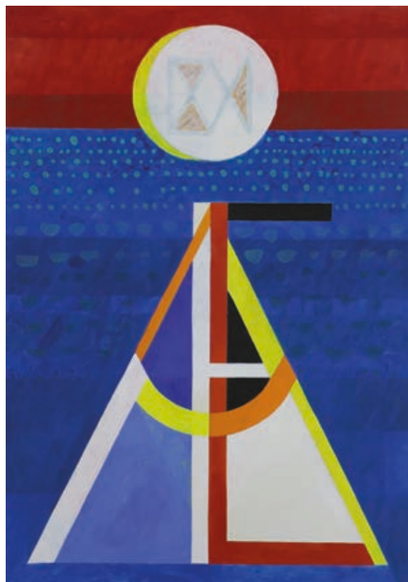
LANTOS FERENC: AMLF , 2014, akril, lemezre ragasztott vászon, 100x70 cm, HUNGART ©2020

A teljességet és az egyetemes hatékonyságot egy sajátos vizuális nyelv megteremtésével kíséri meg elérni: „Az általam keresett vizuális nyelvi rendszernek a lényege az, hogy a valóság jelenségeinek keresztmetszeti és hosszsmetszeti vizsgálatsorozatának eredményeire építve nyúljon vissza a legáltalánosabb vizuális alapokig” – írja a 60-as évek végén. Vizuális mondatokat konstruál, melyek egy feltett kérdésre vagy kérdéscsoportra adott válaszok. Ahhoz, hogy a mondat értelmes legyen, kell egy alapelem vagy egy alaphang, amivel aztán műveleteket lehet végrehajtani: „A legelvontabb vizuális formák és formakapcsolatok alkalmazása csak olyan közösségi vizuális nyelv kialakítására, melyet a maga sajátos problémáinak a megoldásához a társadalom egésze éppúgy alkalmazhat, mint az egyes ember.” Hosszú évek kutatása után, a 80-as években