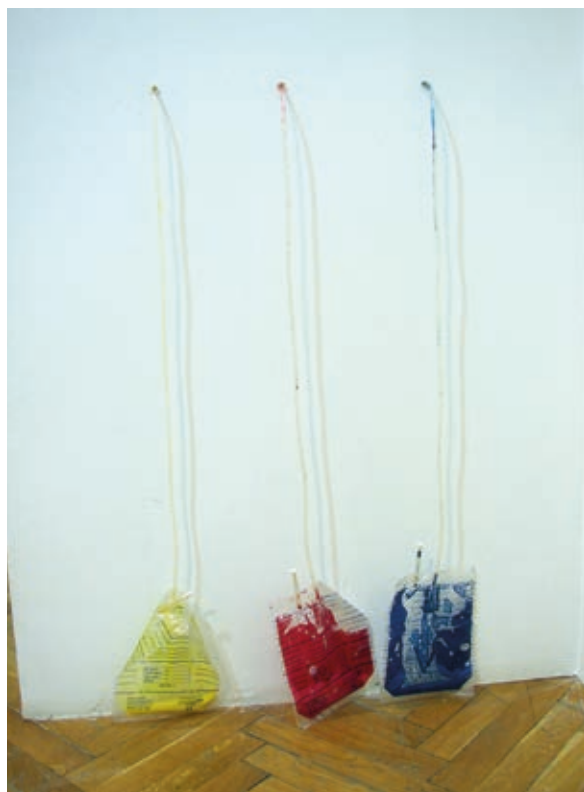
BODÓCZKY ISTVÁN: Falfestmény, 2008, installáció Szent István Király Múzeum, Csók István Képtár, Székesfehérvár

Ilyen előzmények után azt gondolhatnánk, hogy az álom ma egyre nagyobb szerepet tölt be a művészetben, de ehelyett igen ambivalens a kortárs művészet álomhoz fűződő viszonya. Egyfelől az álmok jó ismerősök, impliciten erősen jelen vannak, mivel a kortárs kultúrába olyannyira beivódott a