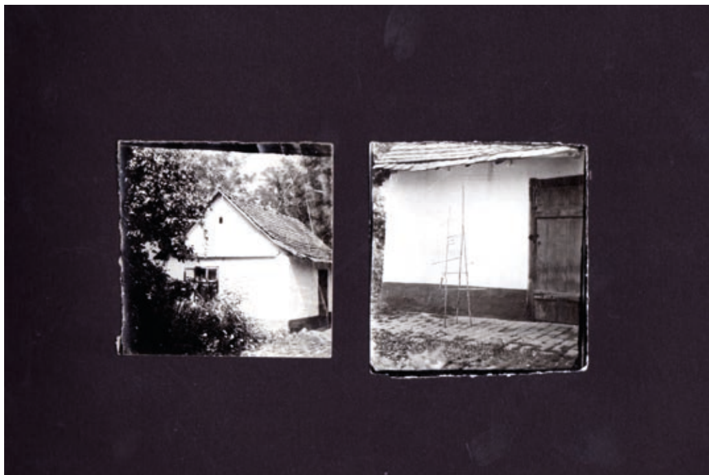
BODÓCZKY ISTVÁN: Egy paradicsomi helyszín , 1960 (2 fénykép: ház Mezőkovácsházán, Toronymodell, ciroknád, m: 2,5 m) Szent István Király Múzeum, Csók István Képtár, Székesfehérvár

Szent István Király Múzeum, Csók István Képtár, Székesfehérvár